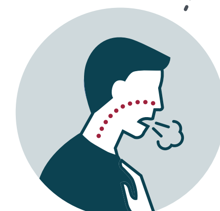
Sensación de falta de aire