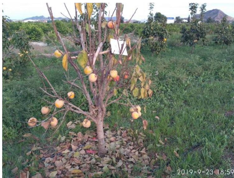
Árbol totalmente defoliado como consecuencia de los encharcamientos y asfixia producidos por la DANA de septiembre de 2019

A raíz de las lluvias de acaecidas en el mes de septiembre de 2019 (DANA) bastantes de los árboles sobre D. lotus ya endurecidos como hemos dicho mostraron un decaimiento acentuado y la cosecha de estos árboles se perdió.