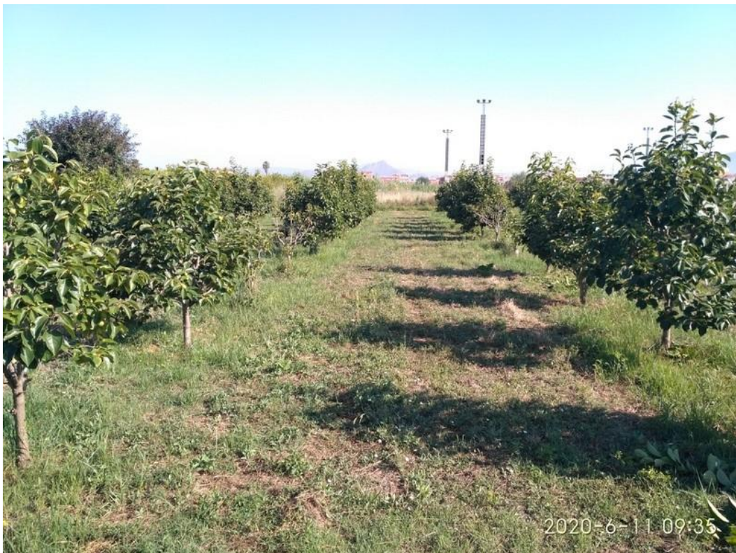
Vista en junio de 2020