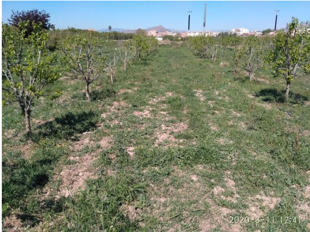
Vista en marzo de 2020