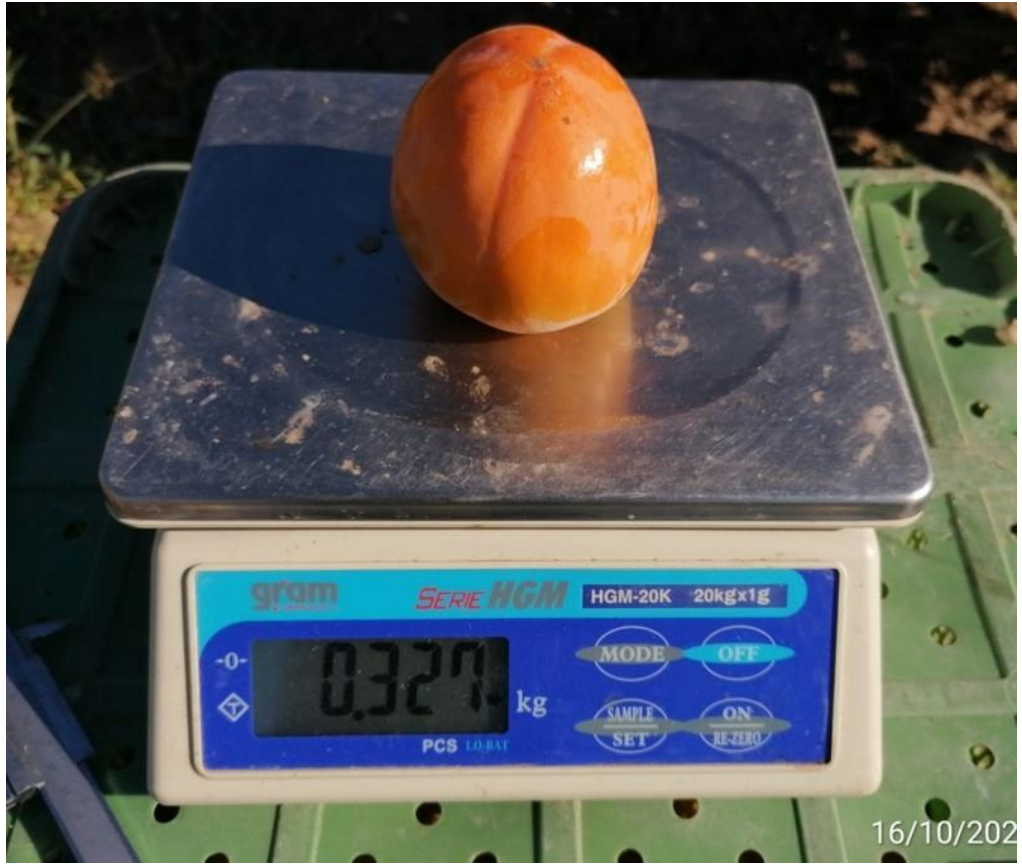
Pesado de frutos