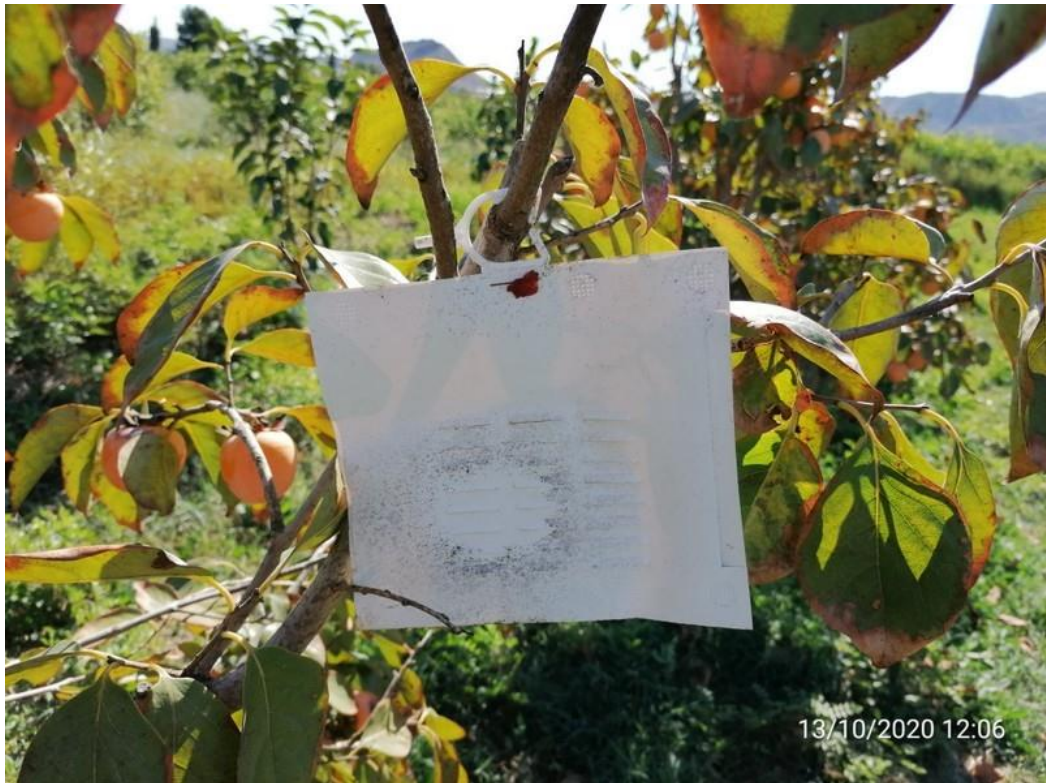
Trampa de atracción y muerte contra C. capitata