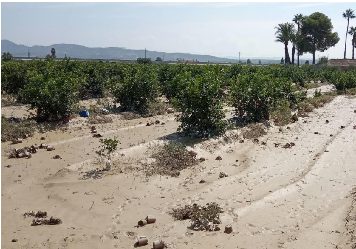
Daños parcela ensayo