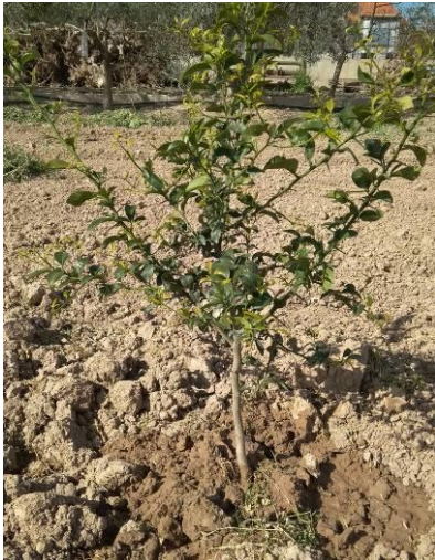
1Forner alcaide 2324