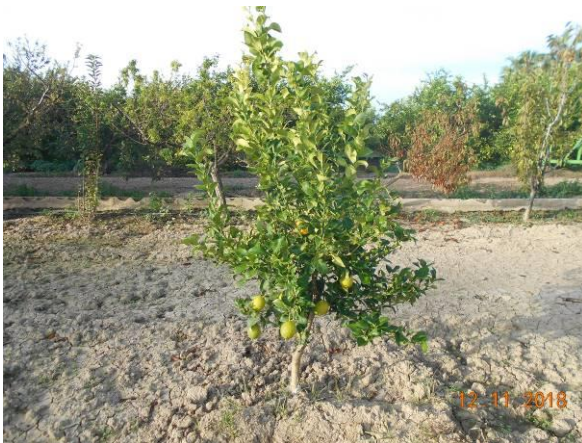
2Forner alcaide 5