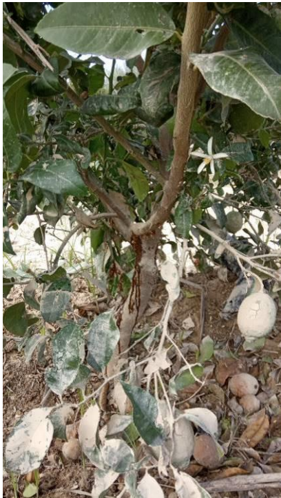
Goma patrón F-A 2324