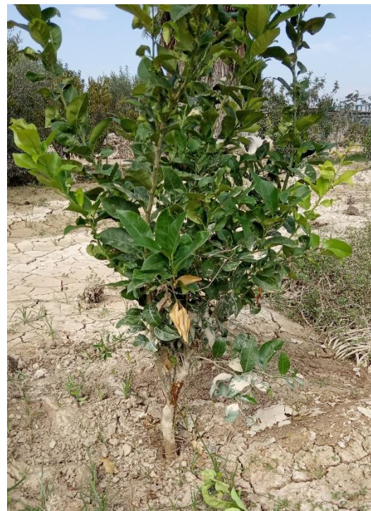
Goma en patrón F-A 5