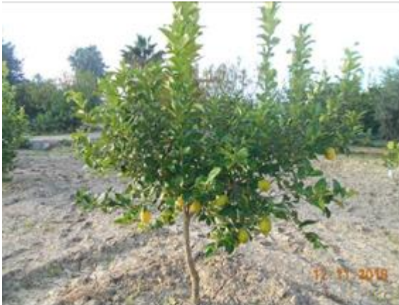
3Forner alcaide 517