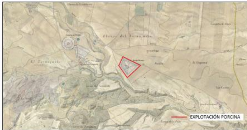
Ubicación catastral de la granja sobre ortofotografía cedida por © SIGPAC. Fuente: Cartografía SIGPAC

Las instalaciones ganaderas se ubican en el Paraje El Pendón, Moralejo, pol. 142, parc. 15 T.M. Caravaca de la Cruz (Murcia) . A continuación, se muestra un plano de situación del proyecto en el término municipal de Caravaca de la Cruz: