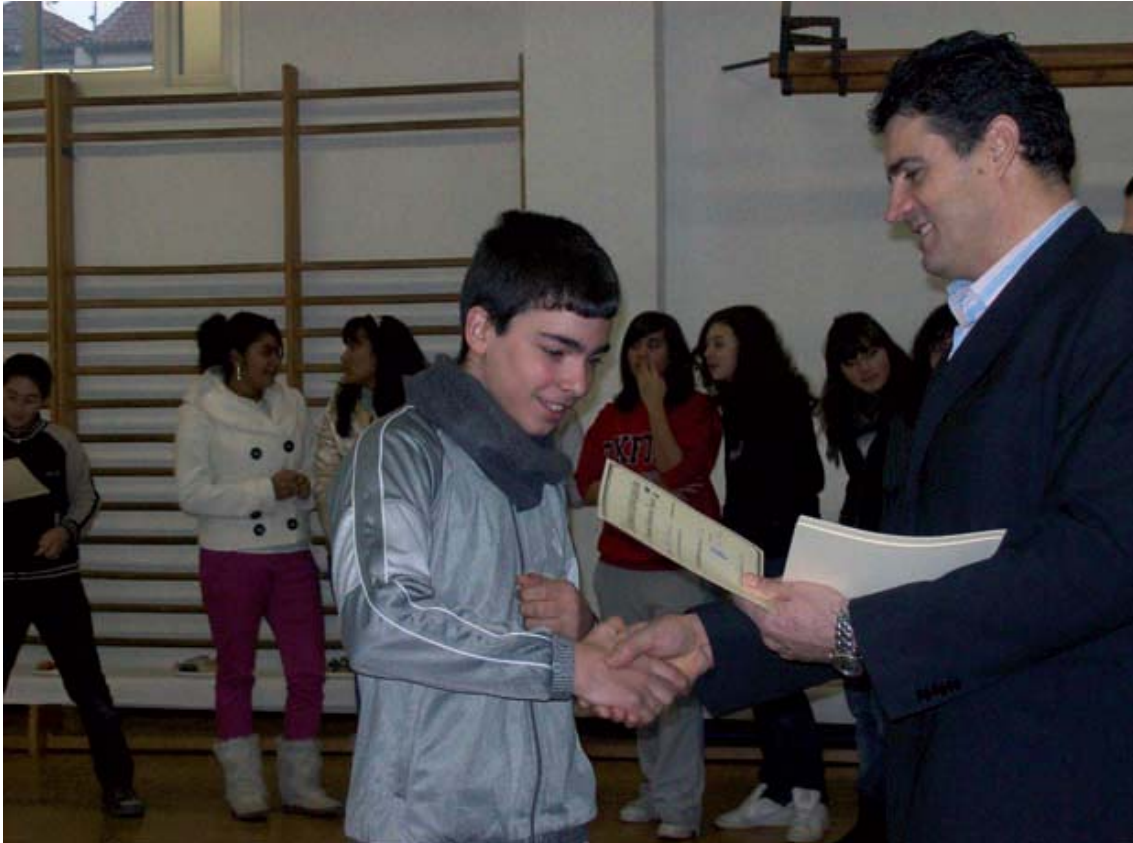
Entrega de diplomas a los alumnos ayudantes.