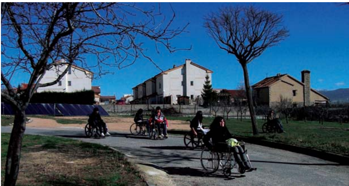
Práctica de voluntariado.