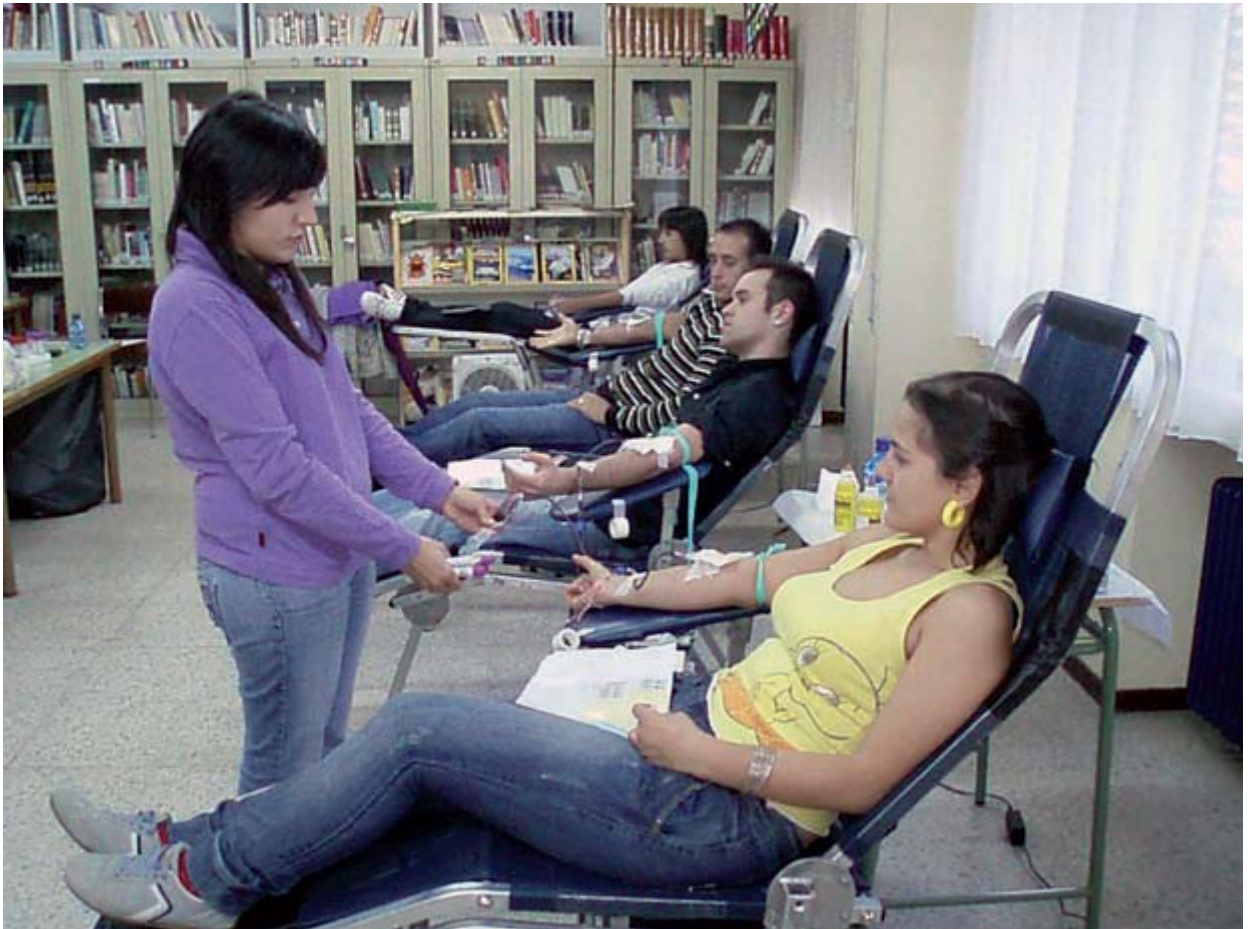
Donación de sangre en el IES María Moliner.

f) Intercambios con alumnos de Alemania e Inglaterra. Los intercambios de alumnos son una herramienta habitual para conseguir una serie de objetivos relacionados con la mejora de la convivencia: