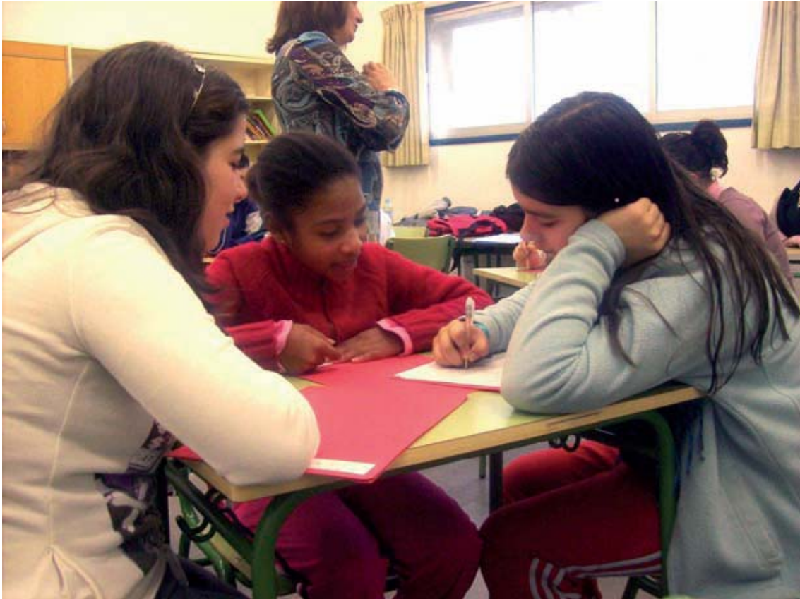
Alumnas del IES María Moliner.

Las características más significativas de nuestro alumnado son las siguientes: