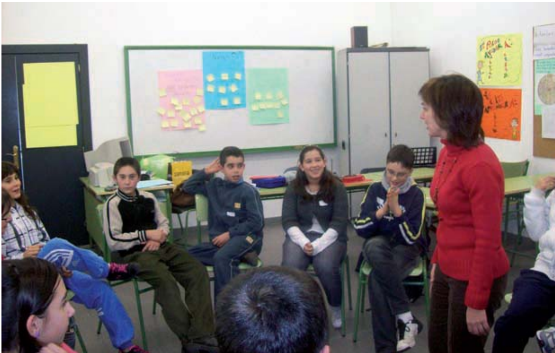
Círculo de convivencia.

Las funciones de los alumnos ayudantes son: