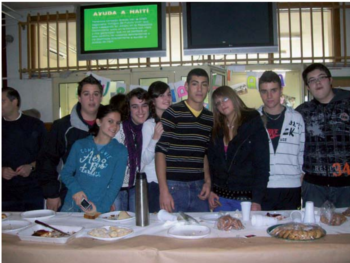
Alumnos en el "chocolate solidario".

a) Semana Solidaria (prácticas de voluntariado). Desde hace trece años, el centro celebra en la última semana del mes de enero su Semana Solidaria, coincidiendo con la celebración del Día Mundial de la Paz.