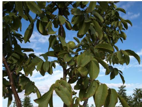
Nogales en Finca las Nogueras (2018).

Las nueces disfrutan actualmente un alto precio en el mercado español, siendo una alternativa de cultivo para muchas zonas de España lo que ha motivado la aparición de nuevas fincas en riego localizado, siendo una clara y real alternativa para el Noroeste de la Región de Murcia, una comarca donde ya se localizan las mayores superficies regionales. Una correcta elección varietal es primordial a la