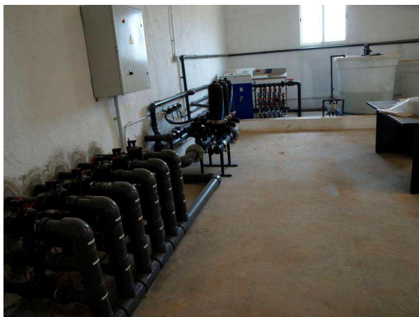
Cabezal de riego Las Nogueras.

Uso de programas de riego para evitar un consumo innecesario del agua. Este programa de riego tiene en cuenta parámetros como el clima y los datos del cultivo.