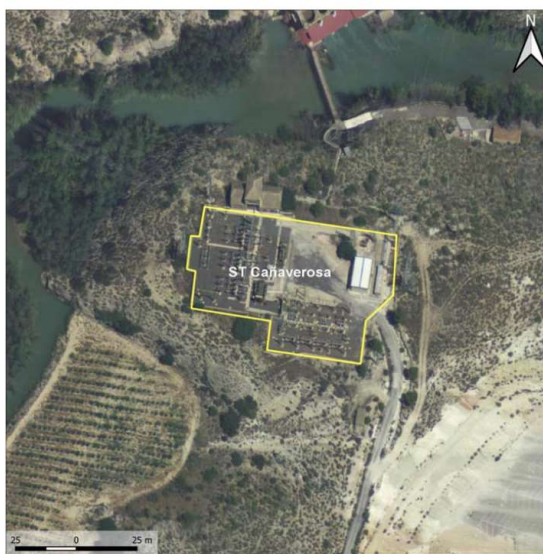
Figura 2. Subestación eléctrica Cañaverosa.