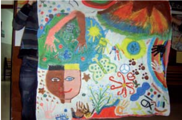
Pintura colectiva contra el racismo.