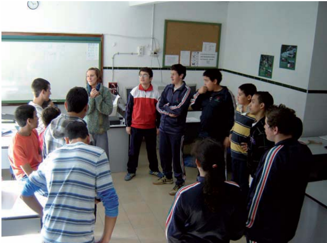
Sesiones de resolución no violenta de conflictos

Recursos: Dos formadoras ( La Ciudad Despierta ) y apoyo del tutor. Los materiales y fotocopias han sido proporcionados por el Colegio y por la Obra Social Fundación “la Caixa”.