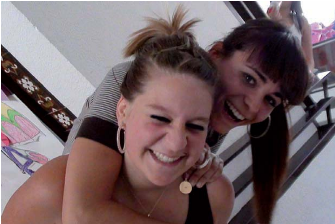
Grabando el documental.