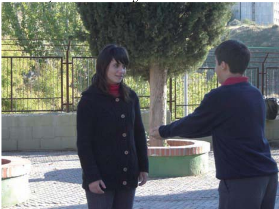
Juego del regalo.

Las distintas actividades de Convive con teatro tienen en común una metodología altamente participativa, vivencial y dinámica . Usamos el arte (principalmente el teatro, pero también las artes plásticas, la música, etc.) para desarrollar las capacidades de expresión individual y grupal, de análisis, comprensión y transformación de la realidad; para crear el encuentro y fomentar el diálogo.