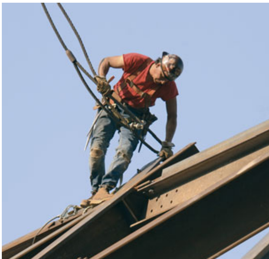
Para analizar cada puesto de trabajo, se desglosaron las diferentes tareas que se llevaban a cabo con las ferrallas, así como con los encofrados de pantallas de muro y de forjado.

Dada la cantidad de trabajadores que se encuentran realizando tareas distintas en este puesto y tras el visionado de las imágenes en vídeo, se decide centrar el cálculo de la tasa metabólica, con una duración de 15 minutos,