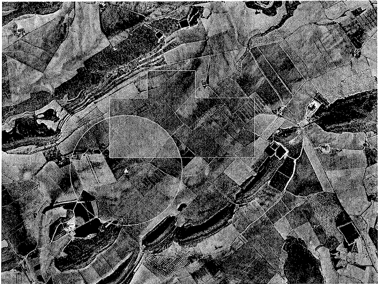
Figura 2. Área mínima de influencia de la colonia de cernícalo primilla que debe excluirse del proyecto.

La principal medida correctora del impacto generado sobre la fauna consiste en modificar la ubicación de la planta, de manera que se mantenga intacta el área de mayor influencia de la colonia, y disminuir así la probabilidad de abandono. La distancia mínima que debe guardar el límite de la planta con la colonia es de 300 m (ver Figura 2). La ubicación definitiva debe seleccionarla el promotor teniendo en cuenta esta afección.