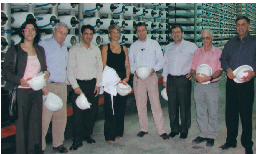
El Gerente del Ente Público del Agua acompañado por la Directora General de Presupuestos y finanzas junto a los responsables de la gestión del agua en Israel durante la visita a la planta desaladora de Ashkelon la mayor del mundo.

En 2005 se ha iniciado la evaluación del proyecto de desalación de la empresa Hydromanagement, S.L. Además, se ha visitado la desaladora de Ashkelon (Israel) la más grande del mundo y se han mantenido contactos en colaboración con la Dirección General de Presupuestos y Finanzas de la Consejería de Economía y Hacienda con los técnicos del Ministerio de Infraestructuras de dicho país y la Empresa Nacional del Agua (Mekorot) para aplicar las mejores prácticas de gestión en materia de producción y gestión de la demanda.