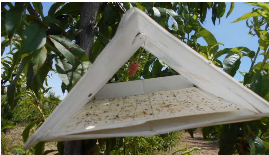
Foto 4. Trampa de monitoreo