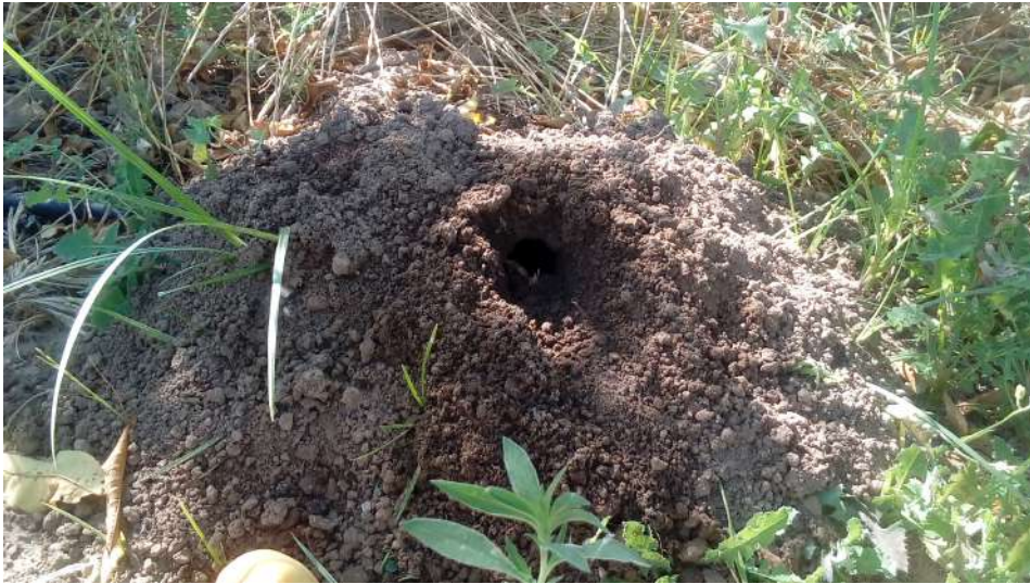
Foto 12. Detalle de topera