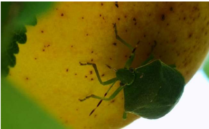
Foto 10. Detalle de las picaduras de succión del chinche verde en albaricoquero