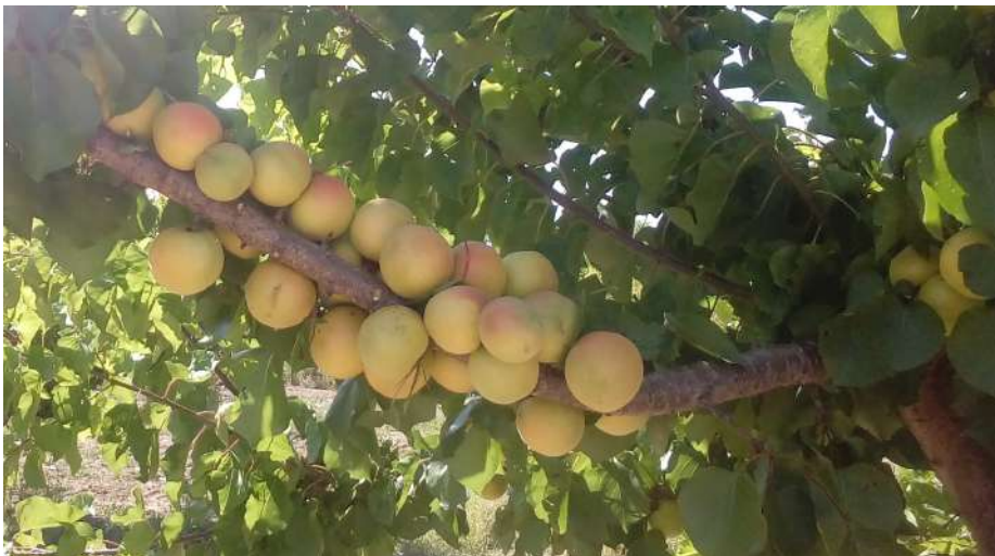
Foto 16. Fructificación Chicano