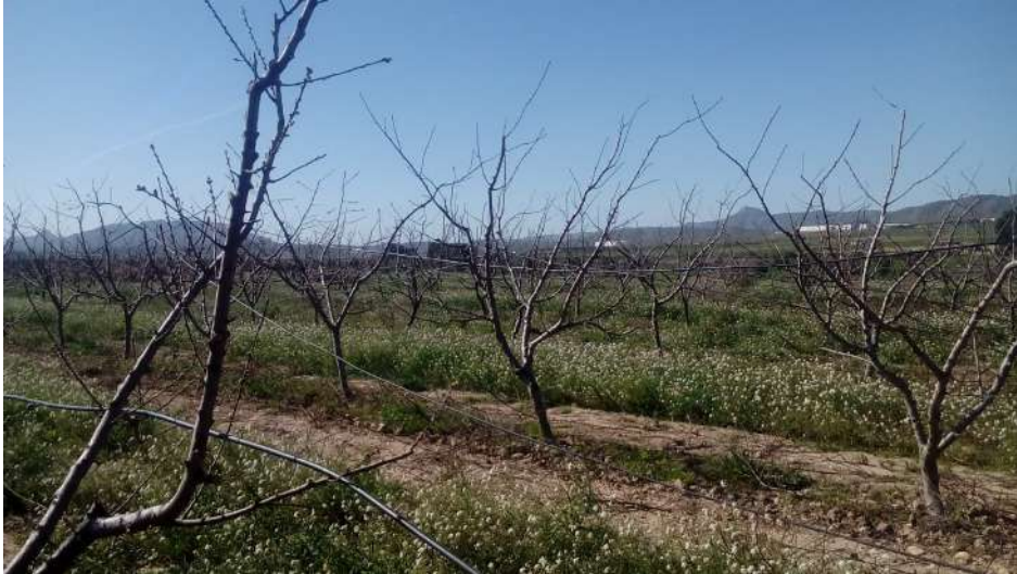
Foto 2. Restos de poda acordonados para su trituración.