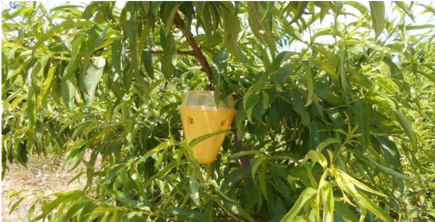
Foto 5. Trampa alimenticia Mosca de la Fruta