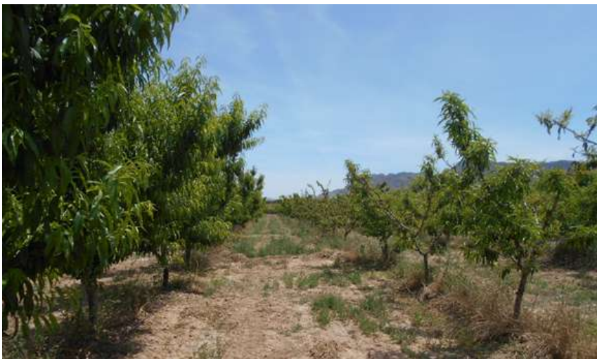
Foto 6. Diferencia de desarrollo de los arboles (izquierda Gorga Tardana, derecha de Castillejar)