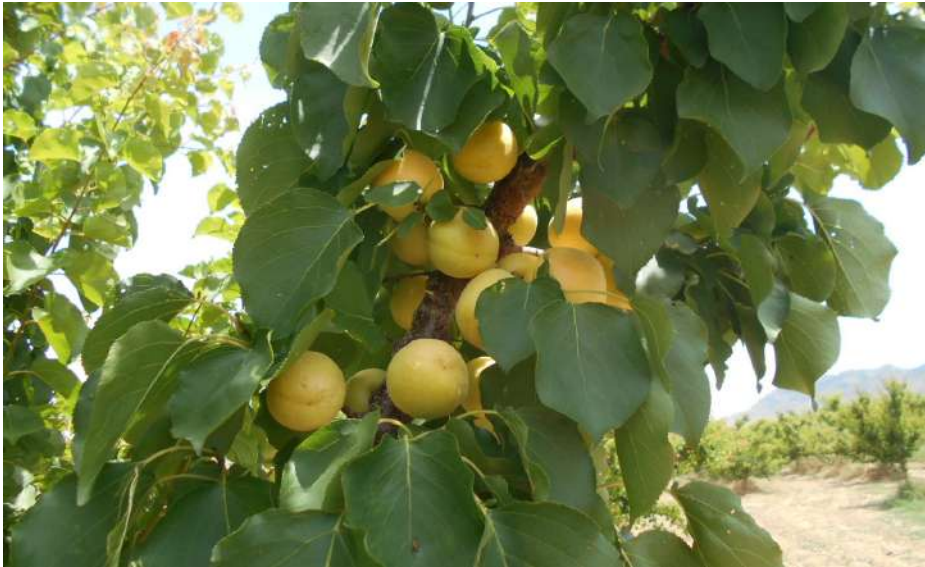
Foto 15. Detalle de fructificación albaricoquero Pacorro