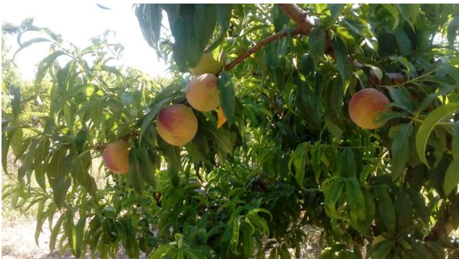
Foto 17. Frutos Periana 5