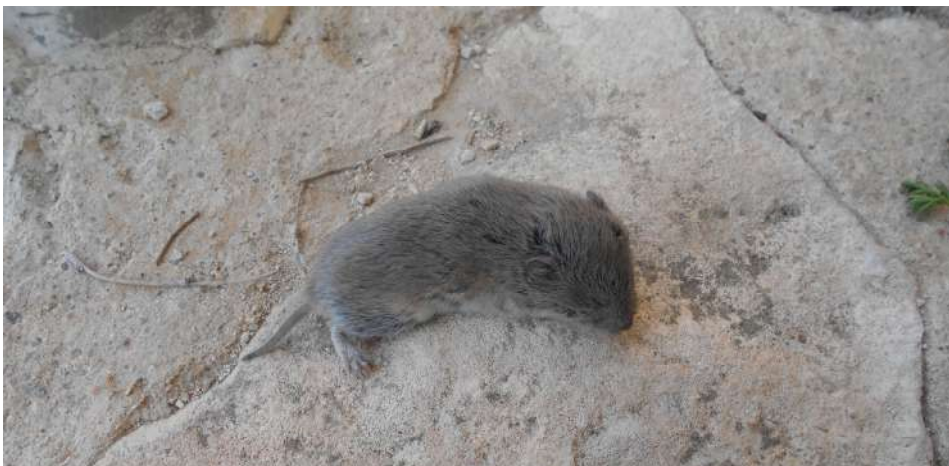
Foto 13. Topillo capturado en la parcela de demostración