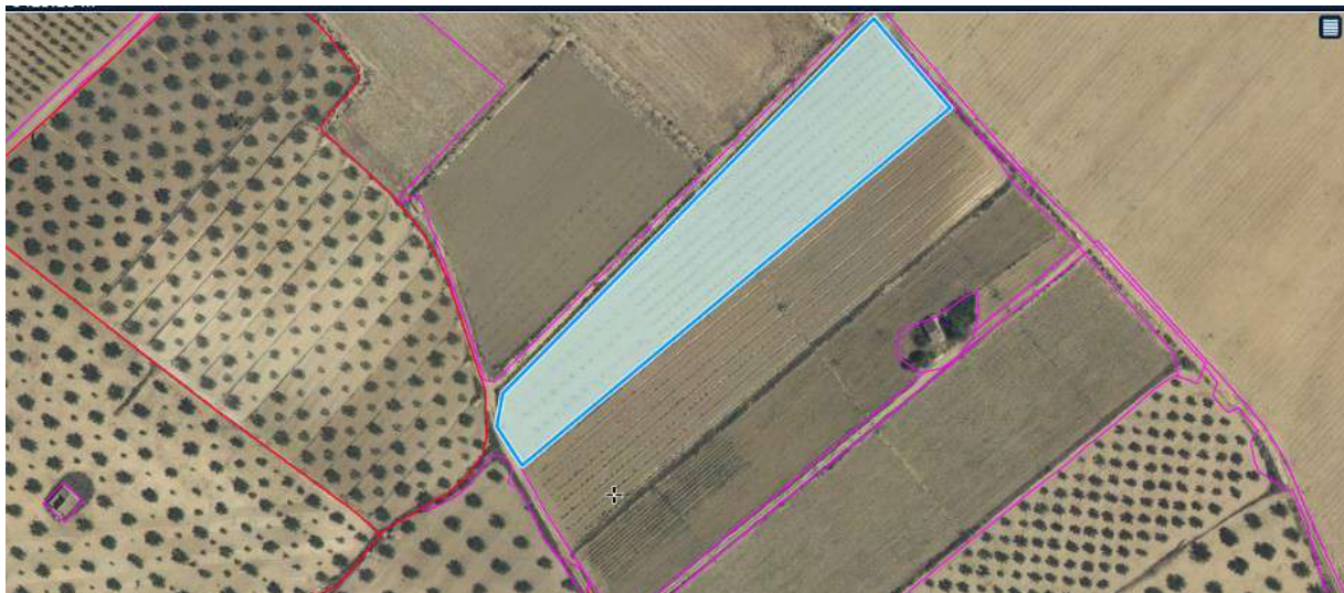
Orto foto 1 parcela de demostración