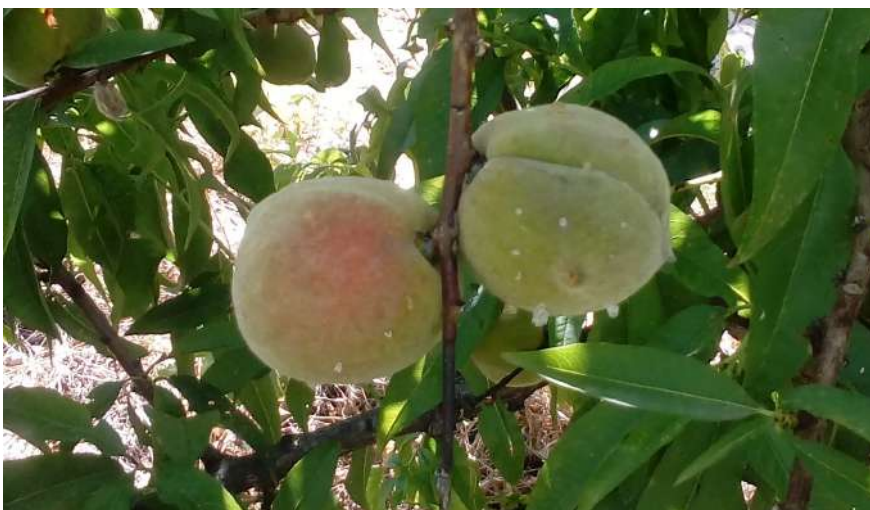
Foto 11. Efecto de las picaduras alimenticia de chinche en melocotón