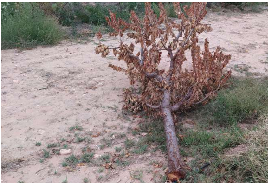
Foto 8. Incompatibilidad de albaricoquero sobre híbrido GF 677 con madera Intermedia de melocotón Caterina