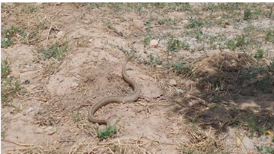
Foto 14. Culebra de escalera. Enemigo natural del topillo