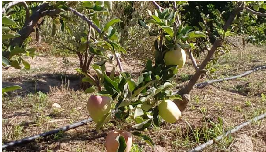
Foto 18. Frutos Manzano de mata