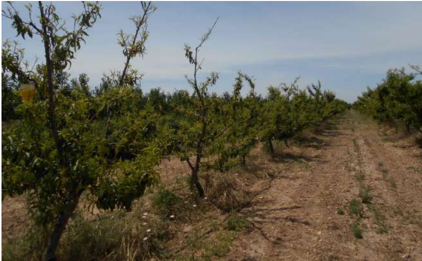
Foto 9. Arboles de Maruja Porvenir muy afectados por ataque de Pulgón y escaso desarrollo