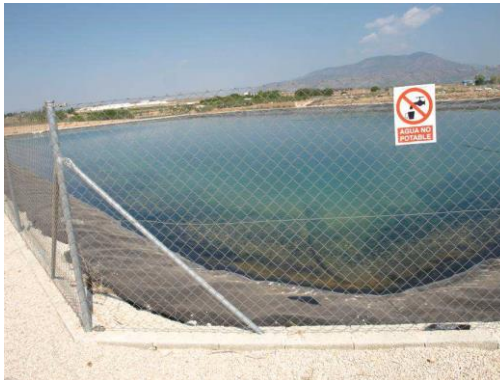
Embalse de riego Las Nogueras.