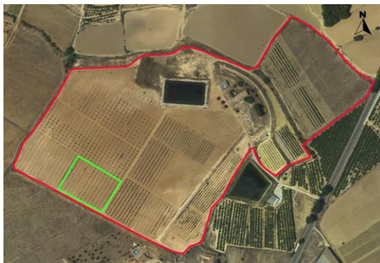
Croquis de ubicación de la parcela pistachos en el CDA La Nogueras.

Se trata de una pequeña parcela con coordenadas UTM-Huso 30 (ETRS-89) ubicada en la finca denominada Las Nogueras de Arriba, propiedad de la Comunidad Autónoma de la Región de Murcia, situada catastralmente en la parcela 385 del polígono 129 en el paraje Los Prados, Caravaca de la Cruz, según el croquis de ortofoto: