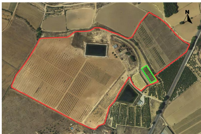
Croquis de ubicación de manzanos CDA Las Nogueras de Arriba.

El proyecto se encuentra situado en una pequeña parcela con coordenadas UTM-Huso 30 (ETRS-89); 596.044/4.210.808 ubicada en el CDA Las Nogueras de Arriba, propiedad de la Comunidad Autónoma de la Región de Murcia, catastralmente en las parcelas 385 del polígono 129 en el paraje Los Prados, T.M de Caravaca de la Cruz.