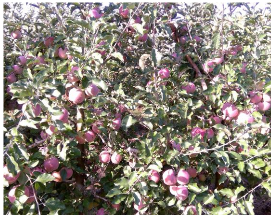
Manzana a la recolección en finca Las Nogueras (2018).

La mayoría de las variedades cultivadas en España corresponden al tipo Golden, seguidas de las del grupo Gala, Red Delicious y de otros como Fuji, Reinetas y Granny Smith. La tendencia en Golden es implantar las más productivas, con buenas características organolépticas y con menos sensibilidad a russetin, en el resto de grupos las nuevas variedades también buscan tener una mejor coloración de la epidermis.