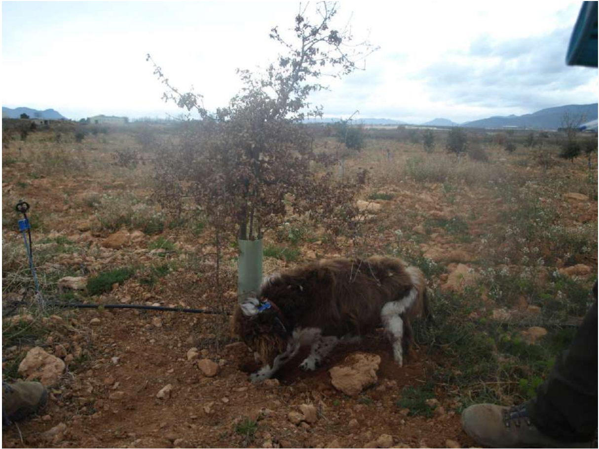
Detalle del perro marcado la zona donde se encuentra la trufa.

El calendario de recolección de la campaña 2019-2020 se ha distribuido en 11 salidas de y han sido: