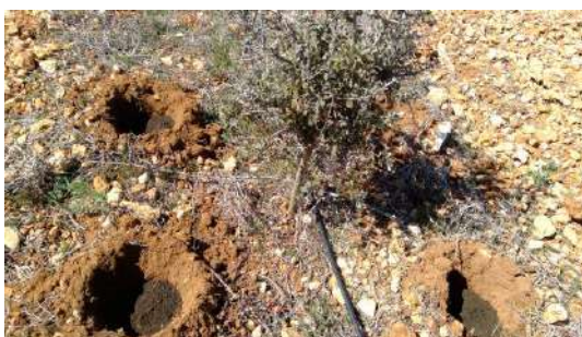
Formación de nidos truferos en CDA Las Nogueras.

Los nidos truferos se formaron con incorporación de substrato esterilizado y con esporas del hongo, tras adicionarle trufas de segunda categoría, secas previamente o congeladas y ralladas, en los cuatro años mencionados.