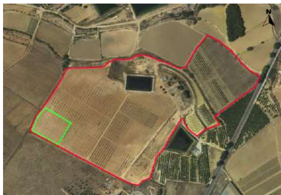
Croquis de Ubicación de la parcela de quercus y trufa en el CDA Las Nogueras.

El proyecto se desarrolla en la Finca Experimental de “las Nogueras”, en el término municipal de Caravaca de la Cruz, catastralmente en parte de la parcela 385 del polígono 129. La parcela se encuentra en el extremo sur-oeste de la finca con coordenadas UTM-Huso 30 (ETRS-89); 595584 /4210772. Está situado entre las parcelas experimentales de pistacho y almendro de floración tardía.