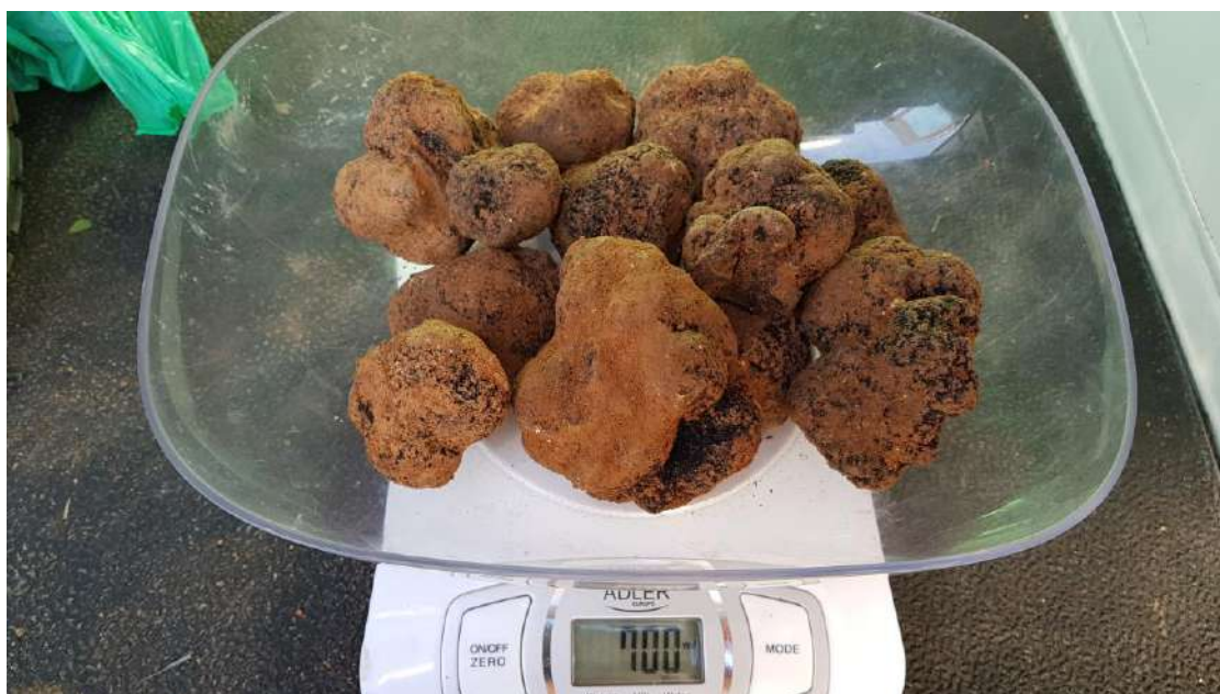
Producción de una de las salidas de 2020

Los datos de recolección por fechas se sumen en el último de los 3 completados, donde están acumuladas las producciones recogidas: