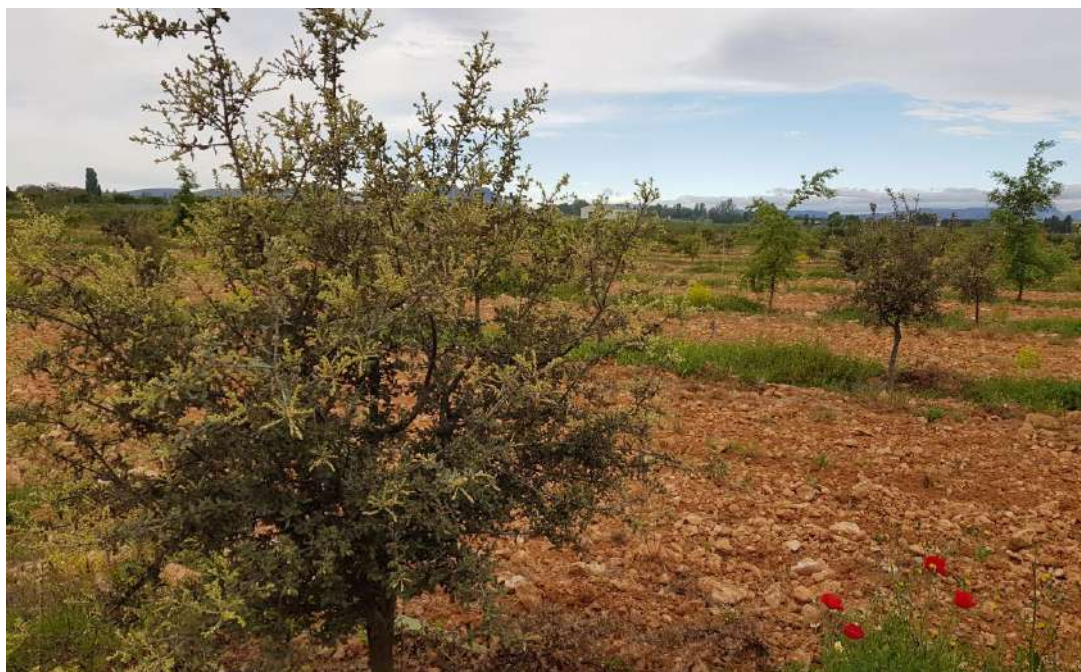
Parcela experimental de quercus para producir trufa negra en la primavera de 2020

Se busca además precisar y transferir el manejo y las mejores técnicas de cultivo, su desarrollo, producciones y ofrecer datos que permitan, en manos del agricultor, una mayor diversificación, sobre todo en zonas con alta protección medioambiental, junto con la producción de cereales, frutos de cáscara y ganadería, en tanto que su rentabilidad y demanda parecen favorables.