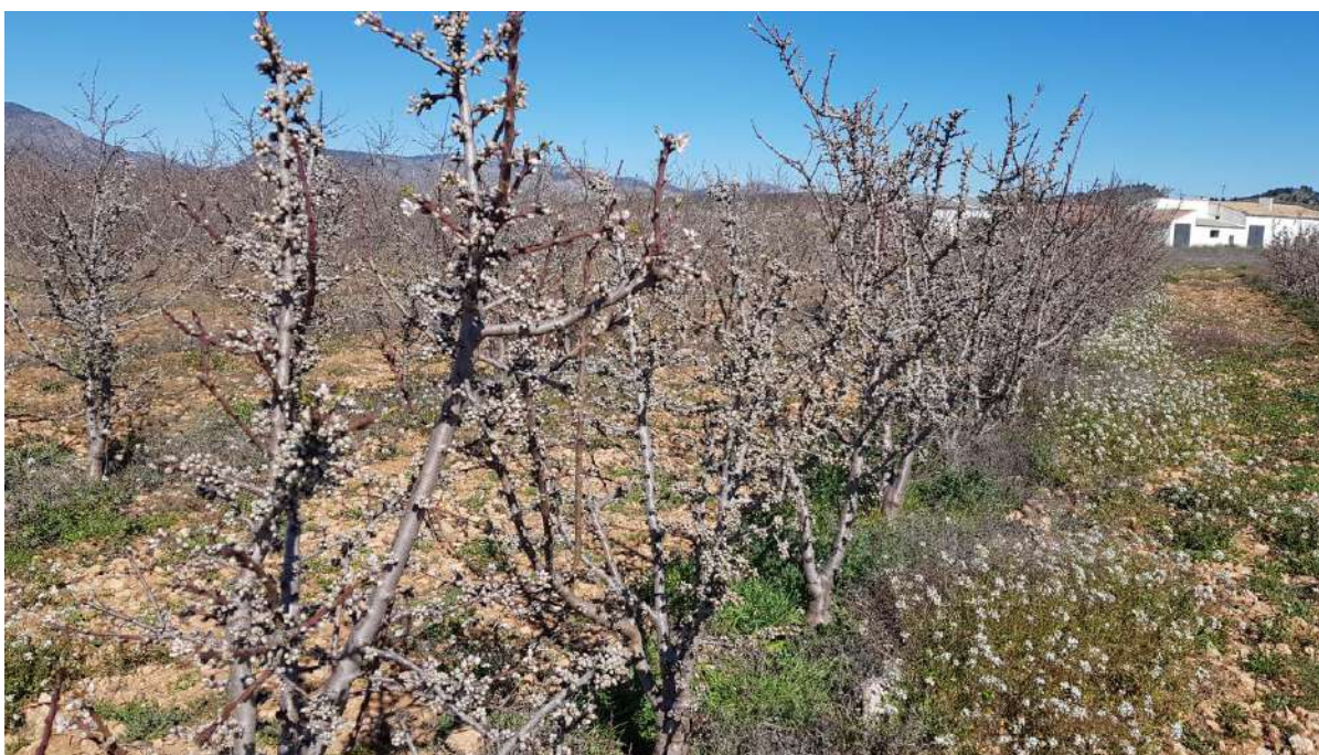
Inicio de la floración de Marinada en el superintensivo, donde se aprecia su escaso desarrollo.

En el superintensivo, parece no existir una buena afinidad entre Marinada y el patrón Rootpac®-20, lo que no ocurre con Penta. En algunas variedades y en este año se caen yemas sin completar su evolución, lo que es más acusado en Tardona, seguramente por falta de frío invernal. En esta última comienzan a verse algunos desarreglos que pueden tener su origen, también, en una falta de afinidad con el patrón Rootpac-20.