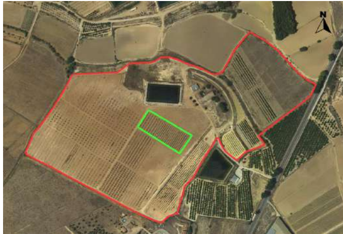
Ubicación de los almendros en intensivo.

La superficie de la parcela demostrativa dentro del proyecto es de 0,55 ha.