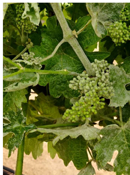
Detalle de infección por oidio en parra, con afección en hojas, tallo y racimo.

Continúan aumentando los daños por oidio en todas las zonas. Insistimos en la continuación de los tratamientos para su control.