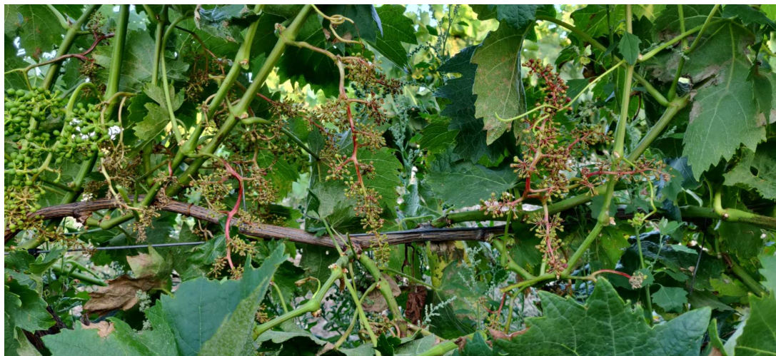
Detalle de racimos afectados por mildiu.

En todas las zonas de producción se observan manchas de Mildiu. Los ataques están afectando a racimos de forma aislada llegando a secarlos. Como el tiempo soleado y seco no acaba de instalarse aún, existe riesgo de que se vuelvan a darse las condiciones de humedad y temperatura adecuadas para el desarrollo y generación de nuevas infecciones por este hongo, por lo que podrían extenderse e incrementarse gravemente estos daños.