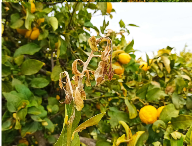
Detalle de daños en limonero (10 de enero, Monteagudo).

Aunque el inicio de esta semana, gracias a abundante nubosidad y precipitaciones que hemos tenido, esas temperaturas se han moderado, la previsión es que durante el mismo martes y los próximos días la temperatura baje de forma notable, incrementándose el riesgo de heladas en nuestros cítricos.