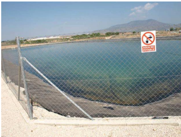
Embalse de riego.