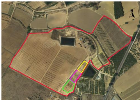
Ubicación de los cerezos.