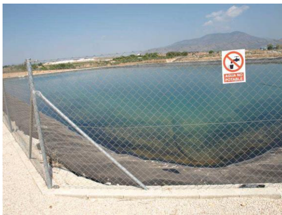
Embalse de riego Las Nogueras.