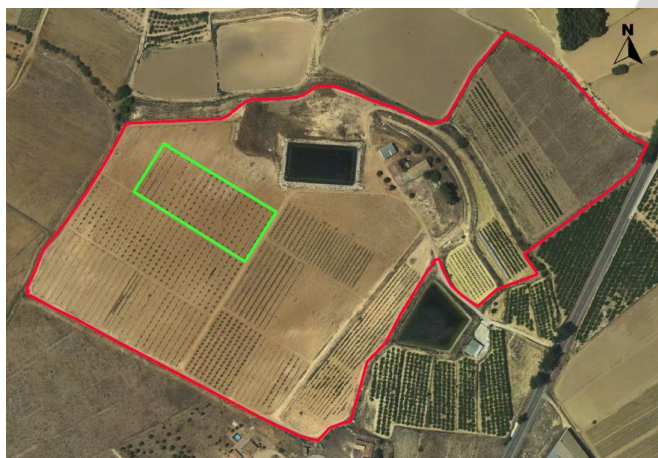
Ubicación de los nogales.

Se encuentra situado junto al camino de la finca y al proyecto de almendros de floración tardía, ubicado en el CDA Las Nogueras de Arriba, propiedad de la Comunidad Autónoma de la Región de Murcia, catastralmente en la parcela 385 del polígono 129, paraje Los Prados de Caravaca de la Cruz.