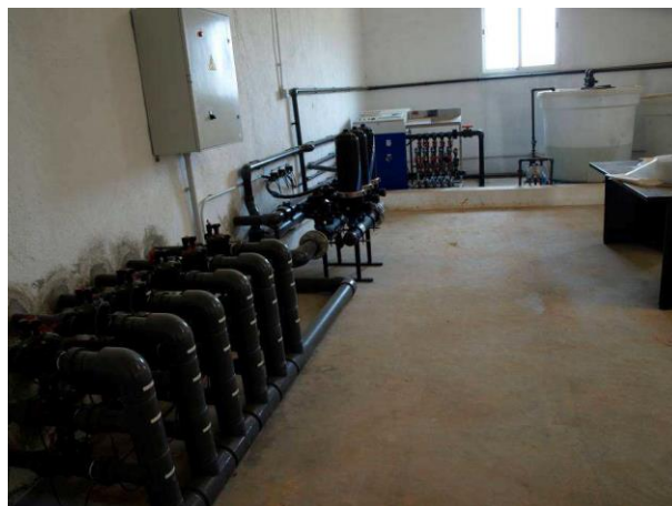
Cabezal de riego Las Nogueras.

Uso de programas de riego para evitar un consumo innecesario del agua. Este programa de riego tiene en cuenta parámetros como el clima y los datos del cultivo.