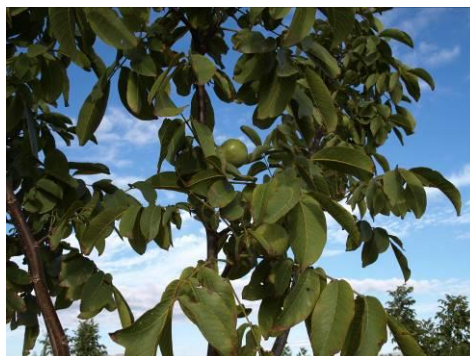
Nogales en Finca las Noguerras (2018).

Las nueces disfrutan actualmente un alto precio en el mercado español, siendo una alternativa de cultivo para muchas zonas de España lo que ha motivado la aparición de nuevas fincas en riego localizado, siendo una clara y real alternativa para el Noroeste de la Región de Murcia, una comarca donde ya se localizan las mayores superficies regionales.