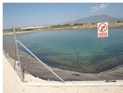
Embalse de riego Las Nogueras.