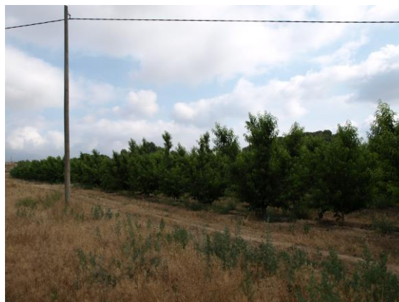
Parcela de ensayo de melocotoneros en Finca las Nogueras de arriba, Caravaca de la Cruz (2018).

La fruticultura del melocotón en la Región de Murcia es un referente en cuanto a calidades y producciones, existiendo un sector viverista y productor de planta muy dinámico en cuanto a la obtención de nuevas variedades. En la vega del Segura predomina el cultivo de variedades tempranas y extratempranas, por el contrario en el noroeste el cultivo del melocotón se centra en el cultivo de variedades de media estación y tardías, dada la climatología de la zona.