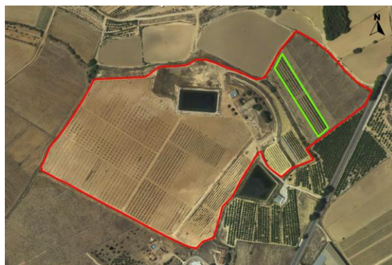
Croquis ubicación de melocotoneros CDA Las Nogueras.

El proyecto se desarrolla en la Finca Experimental de “las Nogueras”, en el término municipal de Caravaca de la Cruz, catastralmente en parte de la parcela 385 del polígono 129, ubicado entre las parcelas de demostración de nogal, al noreste y las de demostración de nogal, al noreste y las de pistacho y trufa negra al suroeste, según el croquis de ortofoto: