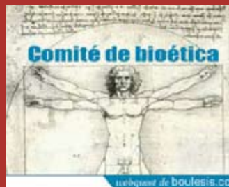
tema recomendado ¿De qué hablamos cuando hablamos de Bioética?