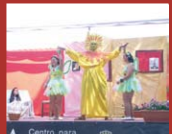
cosas que hacemos