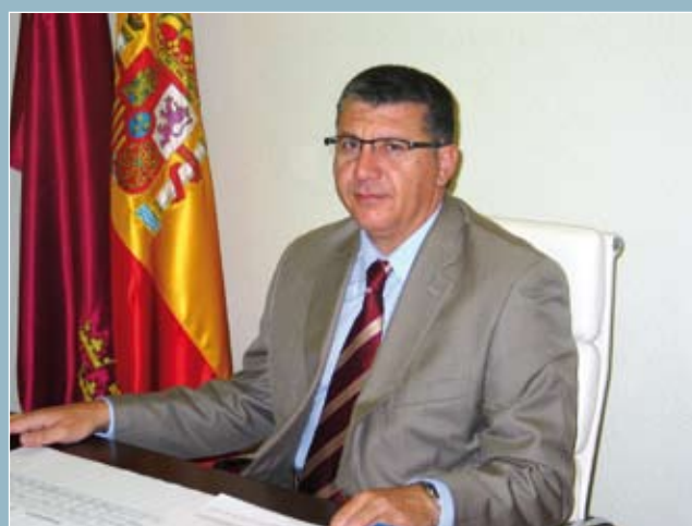
Juan Castaño López. DIRECTOR GENERAL DE PENSIONES, VALORACIÓN Y PROGRAMAS DE INCLUSIÓN.