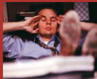
te interesa El estrés laboral y sus aspectos psicosociales