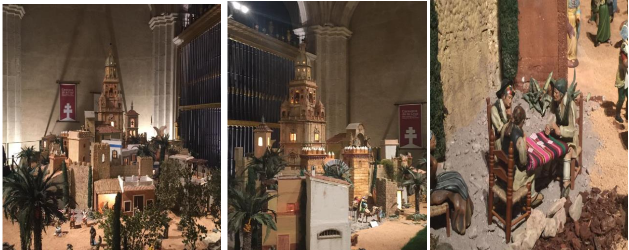
Fotos del Belén en San Esteban