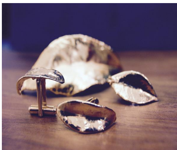
Gemelos y anillos