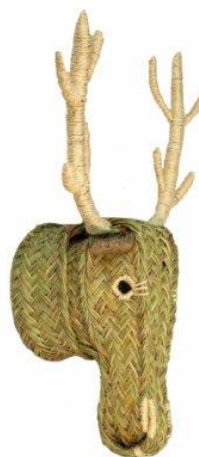
Cabeza de ciervo