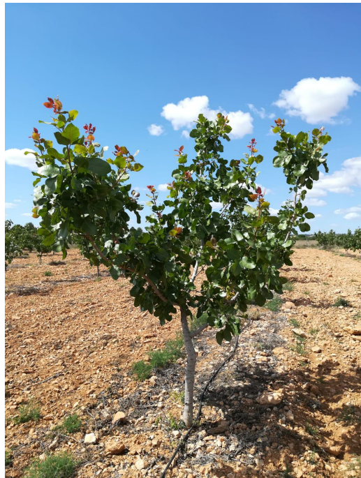
Parcela demostrativa de variedades y patrones de pistacho en CDA "Las Nogueras" (2018).

El objetivo de este proyecto es comprobar y mostrar las producciones, calidades, características, adaptación y, en el fondo, rentabilidad de un grupo de las mejores variedades comerciales de pistacho, en riego localizado e injertadas sobre el pie híbrido UCB-1, tanto en marco tradicional como en uno más intensivo.