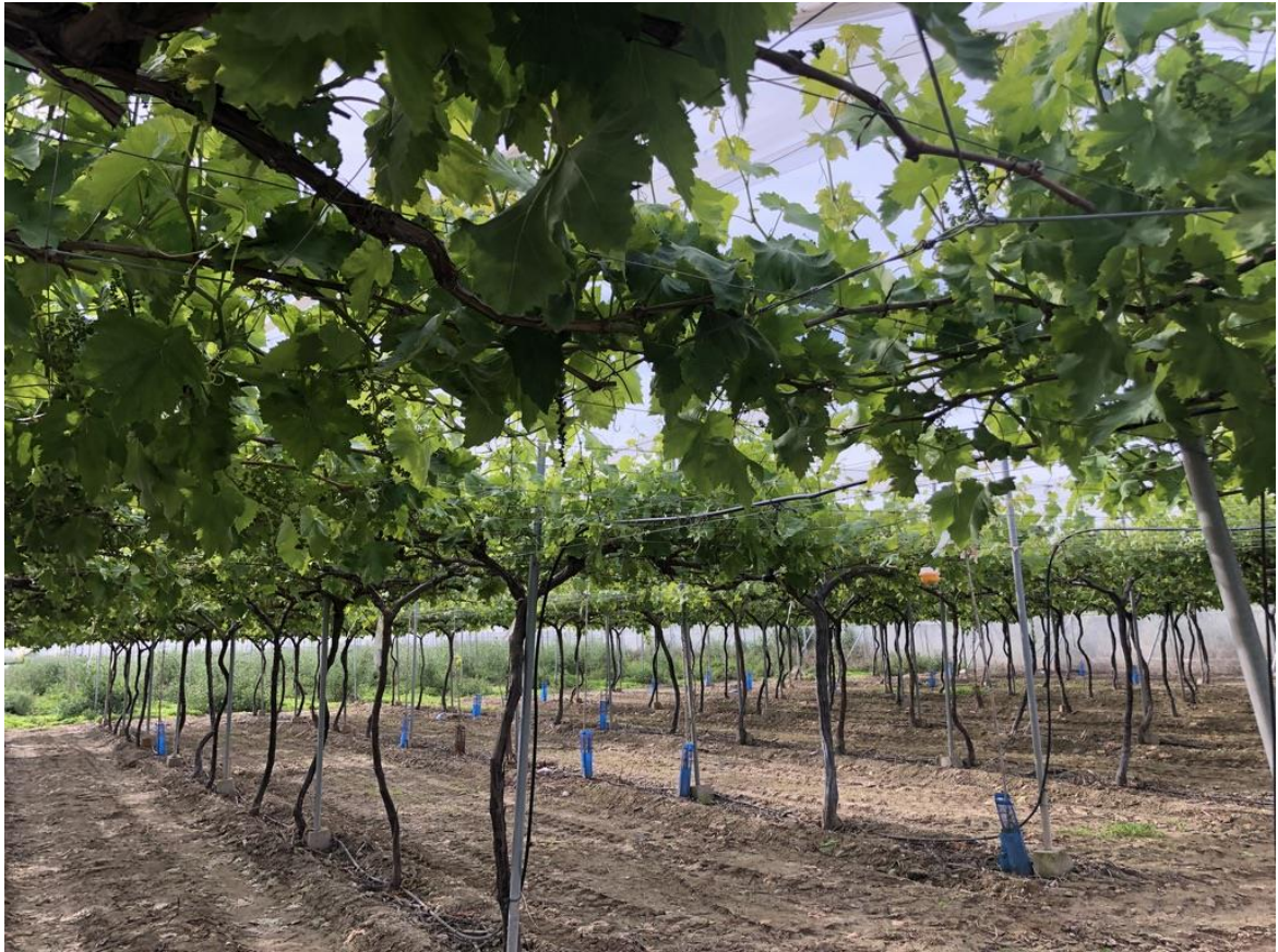
Uva Superior 28-4-2020

Se ha realizado una poda de invierno. Al tratarse de una variedad de baja fertilidad como es Superior, se ha procedido a realizar una poda larga o poda de cargadores, dejando suficientes yemas para compensar la baja fertilidad de las mismas y facilitar que se obtuviera el número de racimos adecuados.