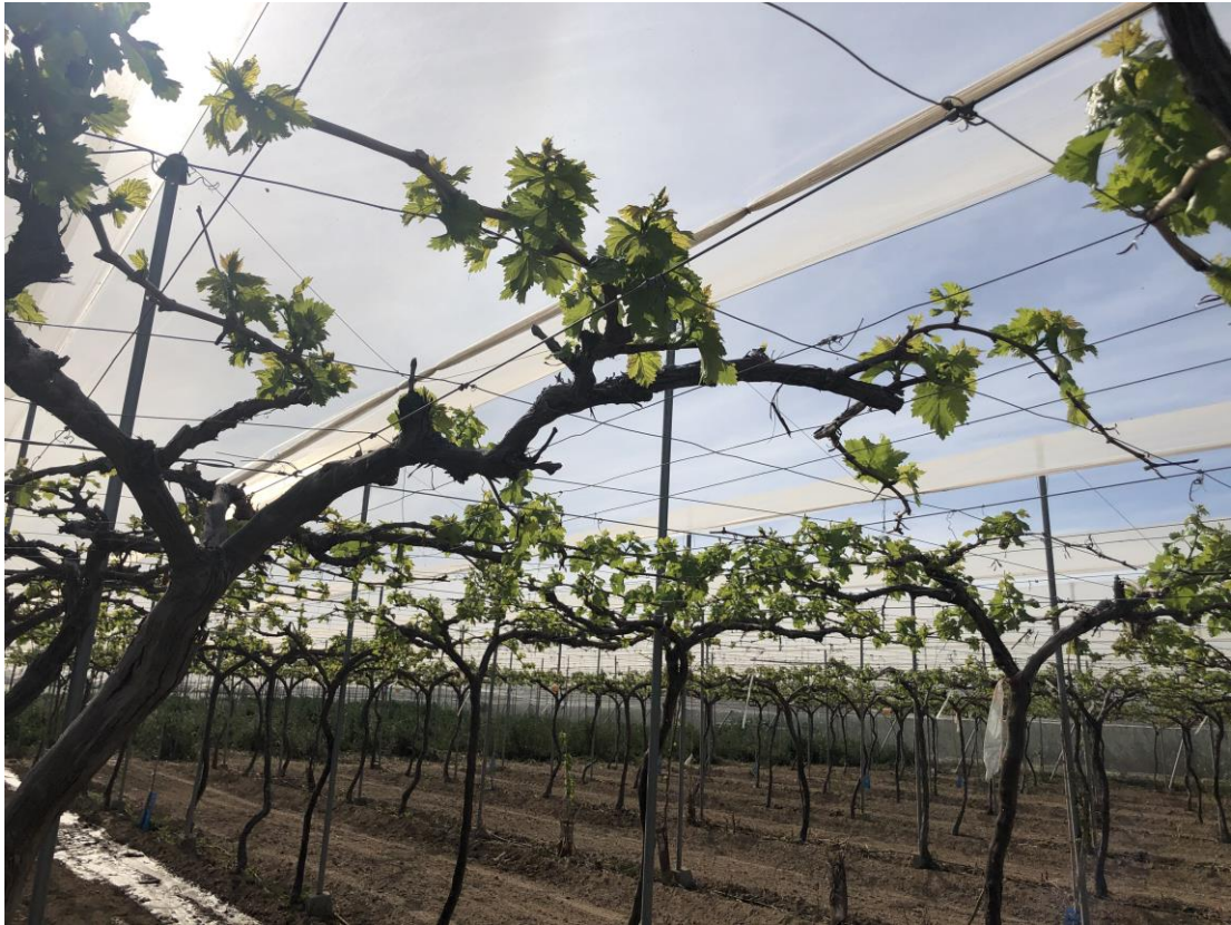
Detalle de poda 12-3-2020

También se ha procedido al deshojado para la prevención de enfermedades fúngicas.