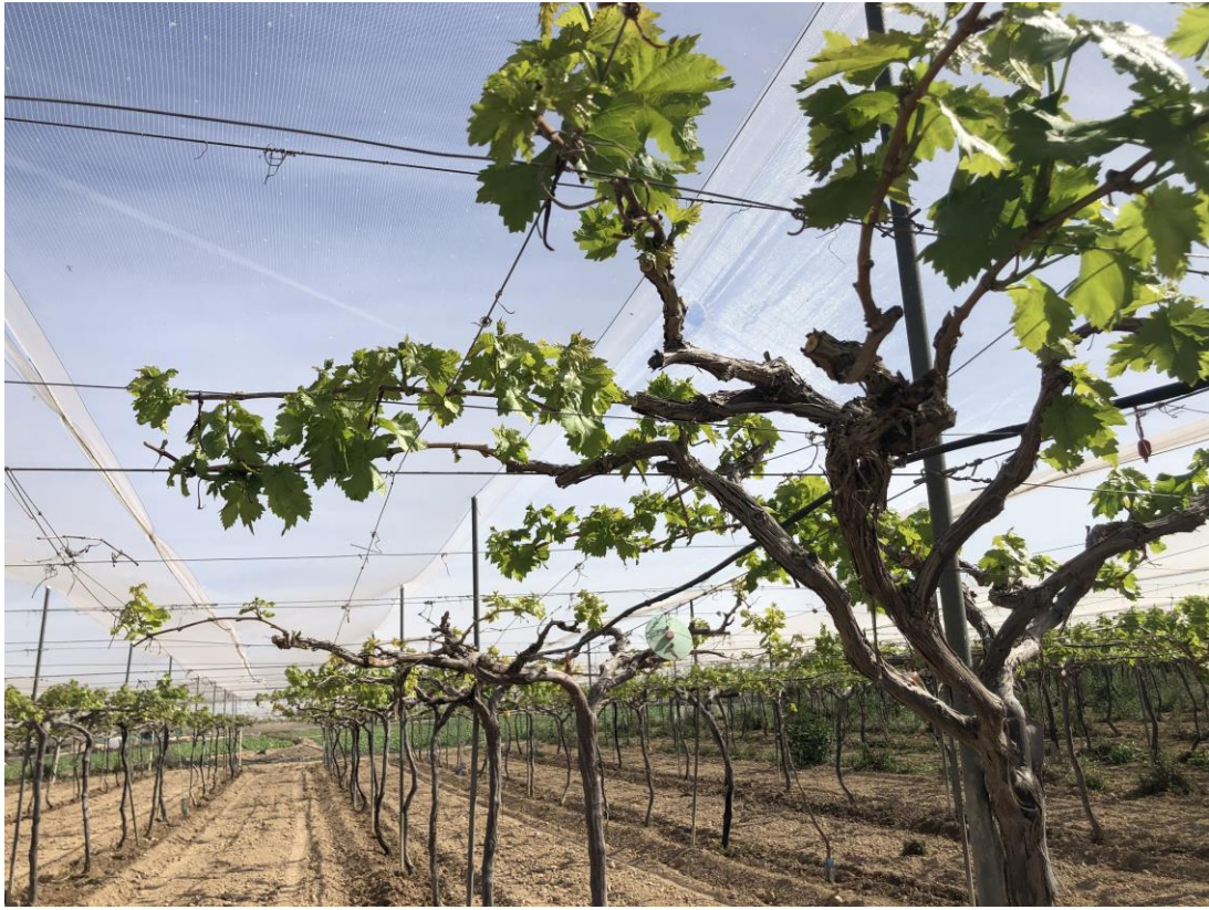
Detalle poda 12-3-2020