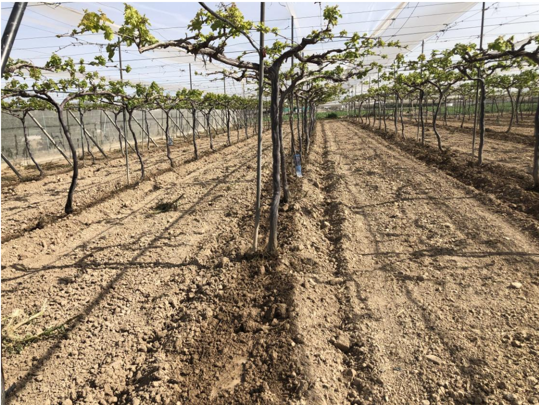
Parras descortezadas año anterior 12-3-2020