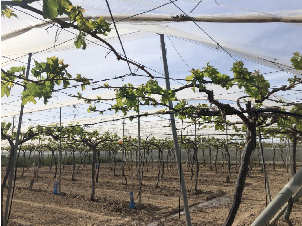
Detalle poda 12-3-2020