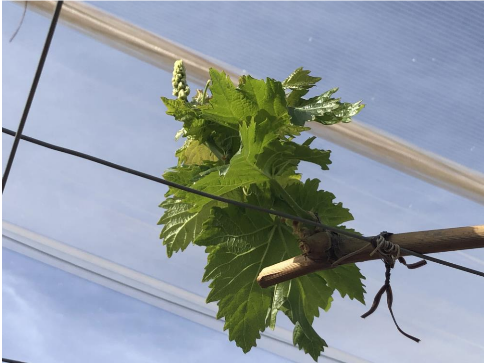
Detalle inflorescencia. 12-3-2020