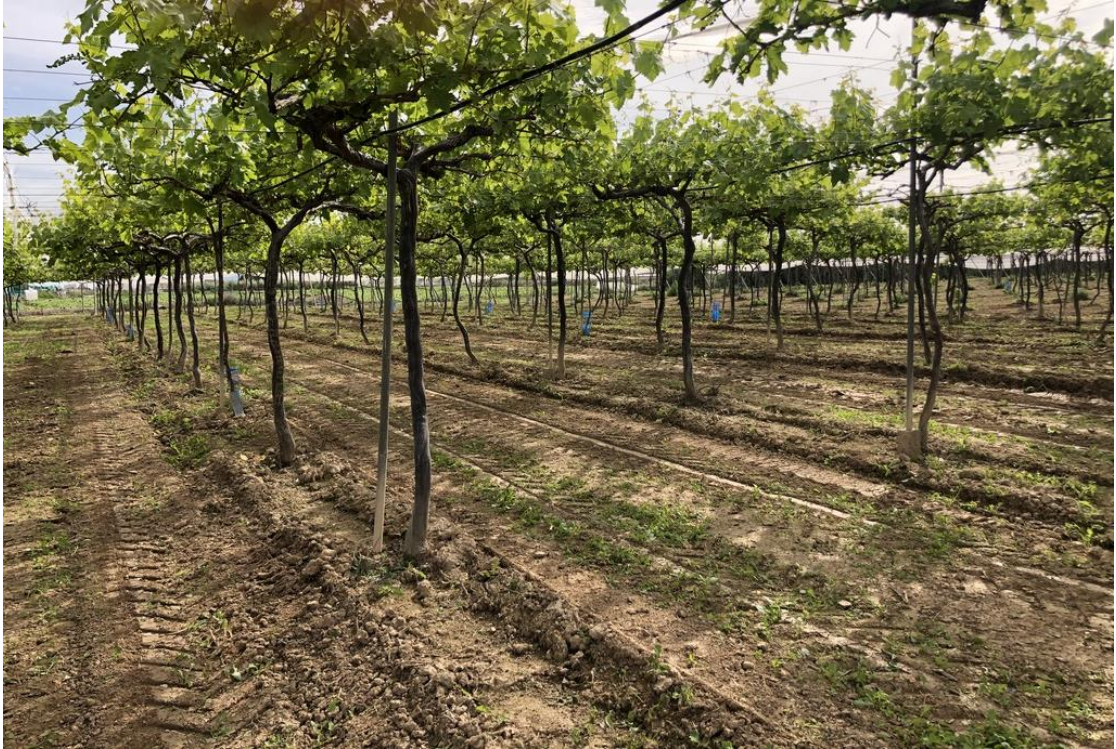
Uva Superior 28-4-2020