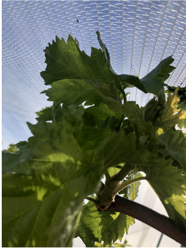
Detalle malla 12-3-2020