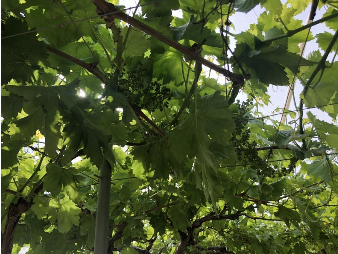
Racimos sanos antes del ataque de mildiu. 28-4-2020