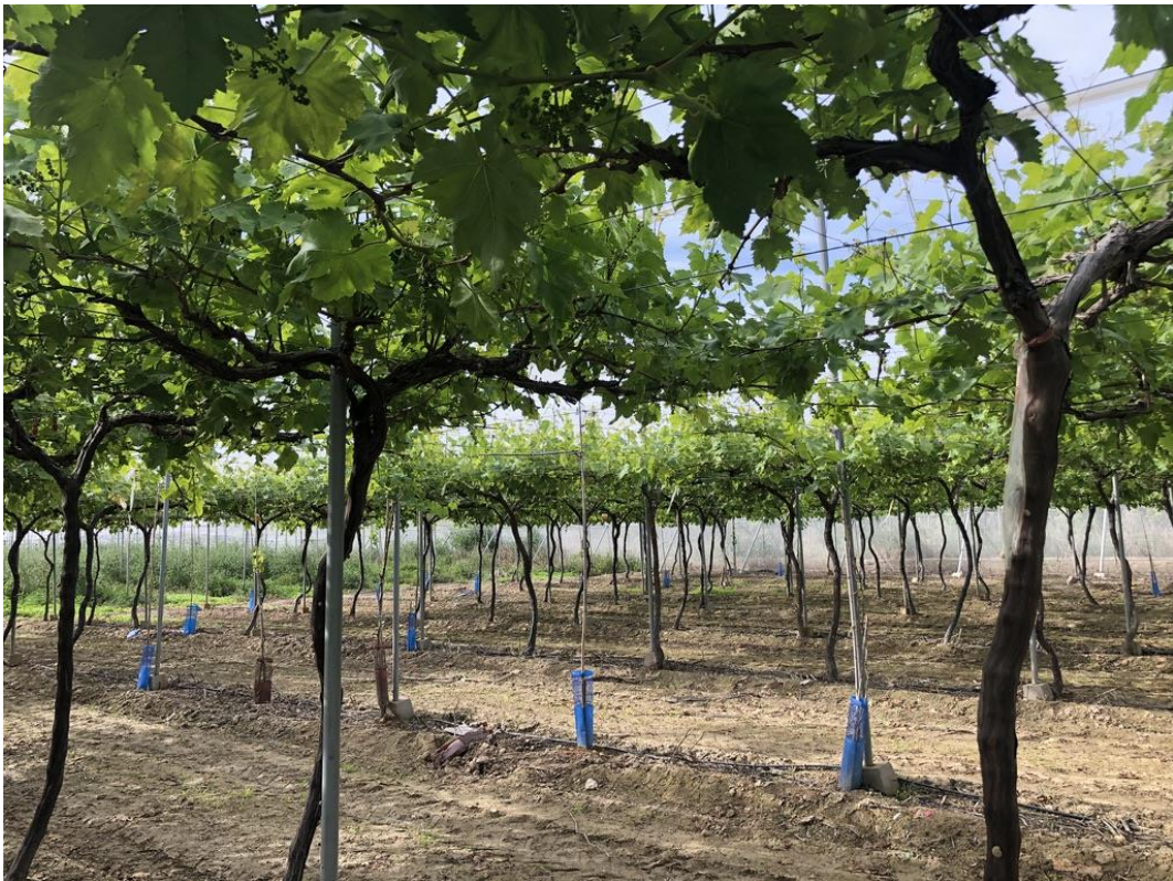
Uva Superior 28-4-2020