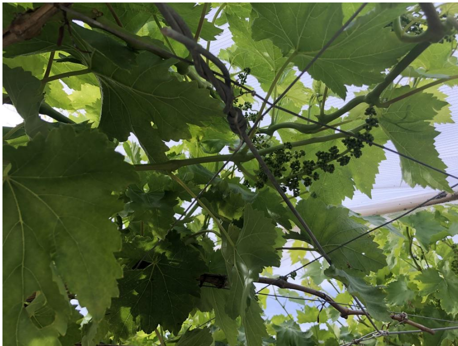
Racimo en formación 28-4-2020