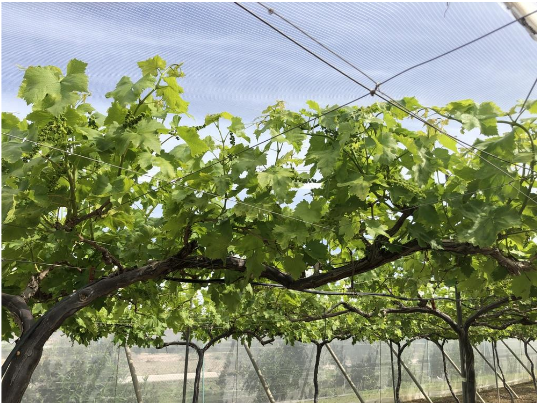
Uva Superior 28-4-2020