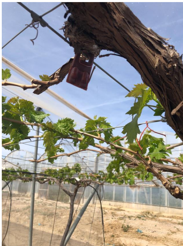
Feromonas para control de Lobesia botrana

El cultivo ha sufrido un fuerte ataque de mildiu debido a las condiciones de humedad que se produjeron durante la primavera, agravadas por la presencia de una parcela abandonada en las proximidades del CDA, de cuya presencia se dio parte a Sanidad Vegetal que notificó al interesado para el arranque de la plantación. Esta situación se ha visto agravada al haberse producido durante el confinamiento debido al Covid-19.