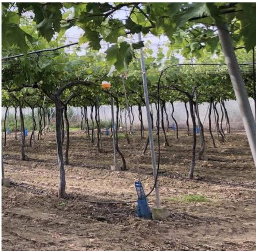
Parral con trampa para control de Ceratitis capitata

Además se han colocado trampas de feromonas para el control de Lobesia botrana y trampas para el control de Ceratitis capitata a base de proteína hidrolizada.