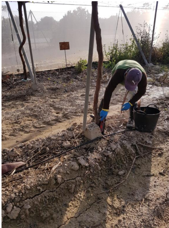
Eliminación de caracoles 28-4-2020

También se ha producido un fuerte ataque de caracoles debido a las lluvias.