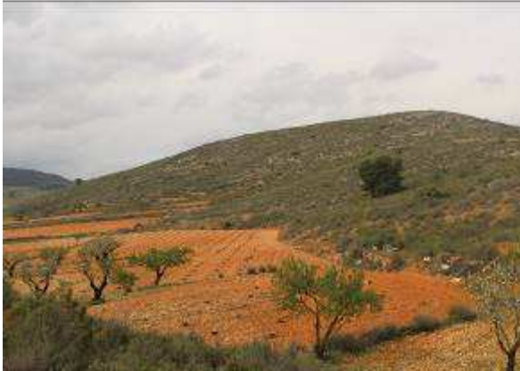
Figura 1. Vista sur de la parcela y entorno próximo en donde se ha proyectado la cantera Santa Rita V.