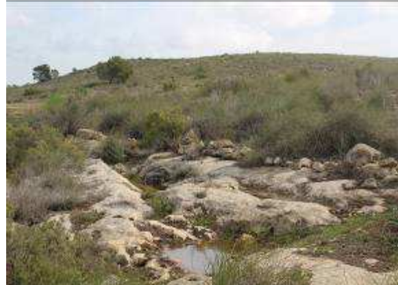
Ilustración 2. Vista norte de la parcela y entorno próximo en donde se ha proyectado la cantera Santa Rita V.