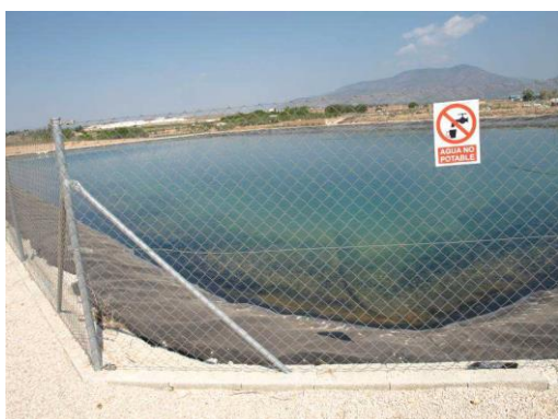
Embalse de riego del CDA Las Nogueras.