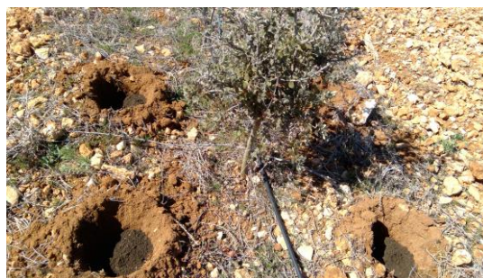
Formación de nidos truferos en CDA Las Nogueras.

La plantación de encinas y quejigos se realizó en marzo de 2014 y se repusieron las marras ocasionadas. Los nidos truferos se formaron unos, con incorporación de substrato esterilizado y con esporas del hongo, otros con el mismo substrato y trufas de segunda categoría ralladas, en noviembre 2017 y una tercera tanda, con humus de lombriz y esporas del hongo, en abril de 2018.