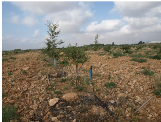
Parcela de quejigos y encinas micorrizadas con trufa negra en la Nogueras 2018.

Con este proyecto se pretende comprobar la adaptación del cultivo de encinas y quejigos, con elevados porcentajes de micorrización con trufa negra " Tuber melanosporum ", para hacer rentables determinadas superficies agroforestales, en condiciones específicas de suelos calizos, pedregosos y clima por encima de los 700-800 m. de altitud, de las que disponemos de manera más abundante que en el resto de la Región y donde las alternativas son muy reducidas.