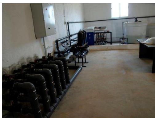
Cabezal de riego del CDA Las Nogueras.