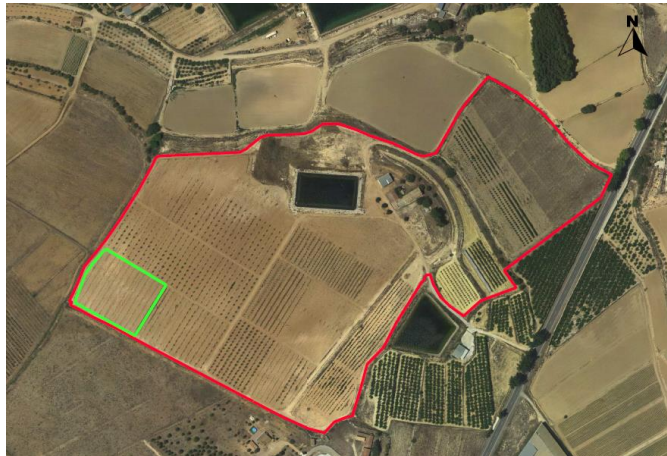
Croquis de Ubicación de la parcela de quercus y trufa en el CDA Las Nogueras.

El proyecto se desarrolla en la Finca Experimental de “las Nogueras”, en el término municipal de Caravaca de la Cruz, catastralmente en parte de la parcela 385 del polígono 129. La parcela donde se ubica el cultivo de trufa negra se encuentra en el extremo sur-oeste de la finca con coordenadas UTM-Huso 30 (ETRS-89); 595584 /4210772. Está situado entre las parcelas experimentales de Pistacho y Almendro de floración tardía.