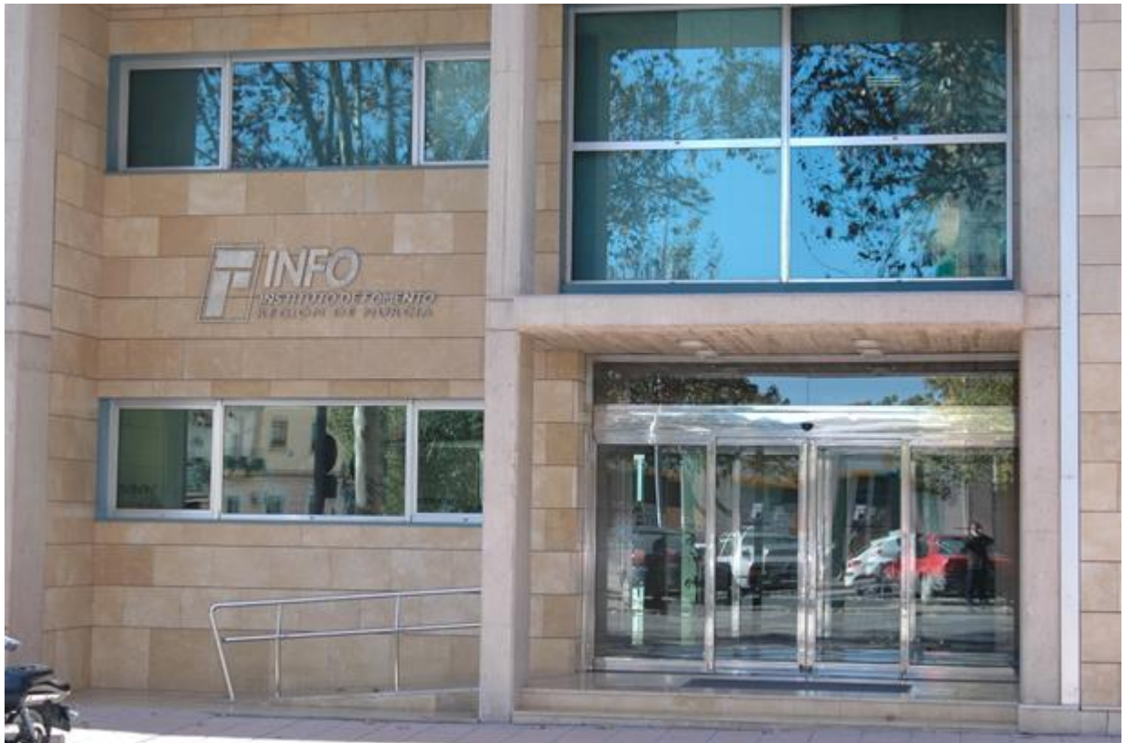
Instituto de Fomento de la Región de Murcia