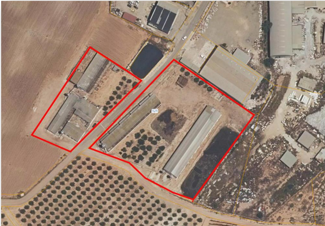
POLÍGONO 521, PARCELAS 3 Y 9 DE FUENTE ALAMO