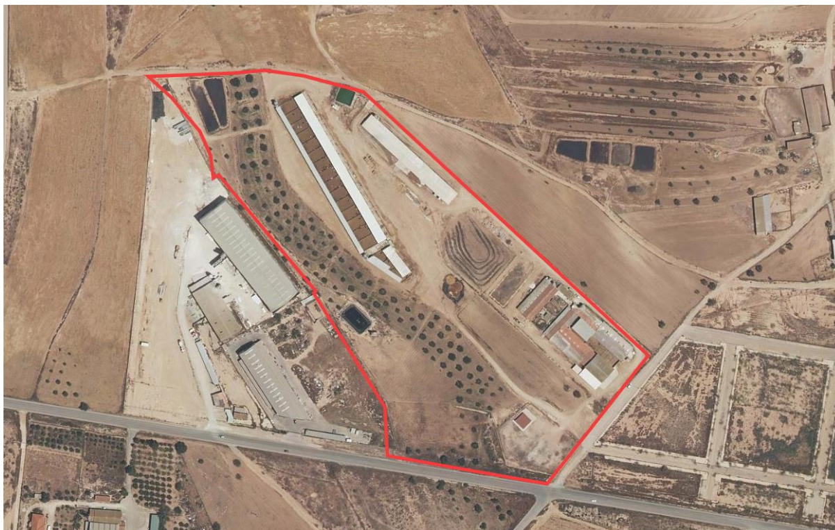
Figura 2. Mapa de localización del proyecto (Polígono 19, parcela 232)