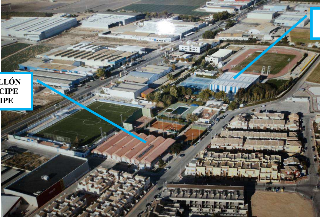
PABELLÓN PRÍNCIPE FELIPE