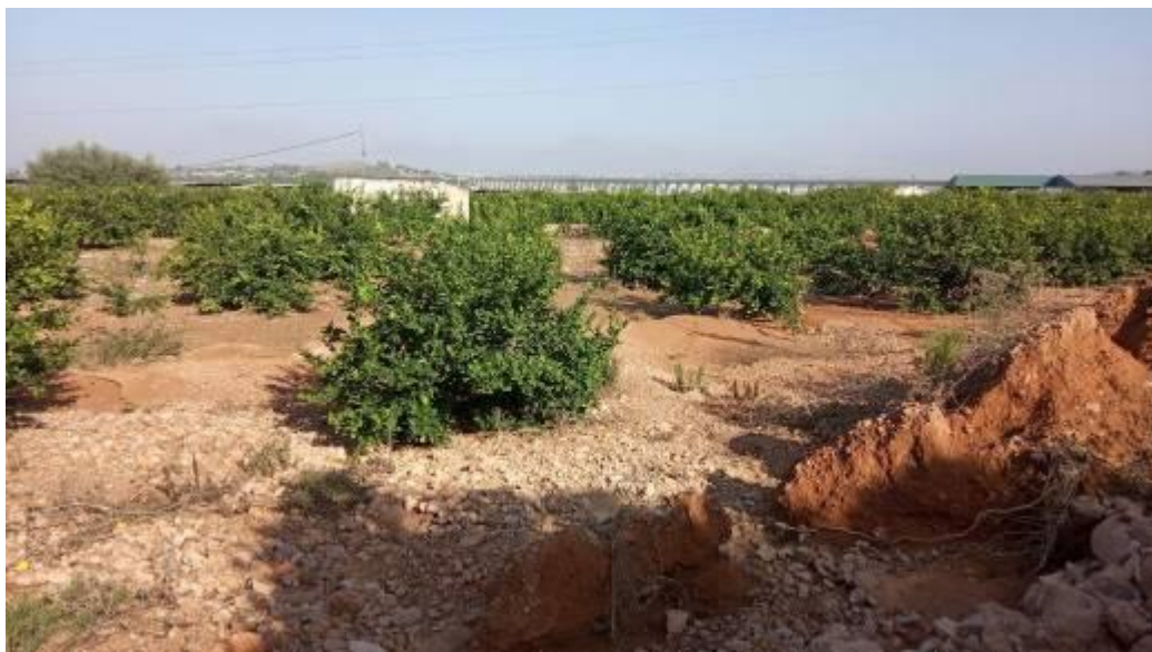
Daños producidos por arrastres y acumulación de tierras.