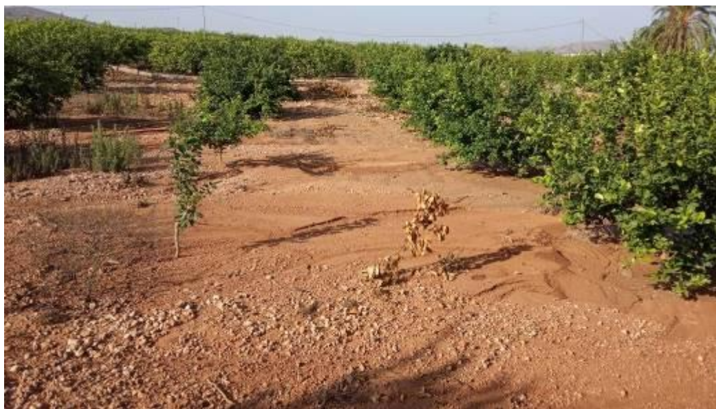
Acumulación de tierras sobre troncos árboles.