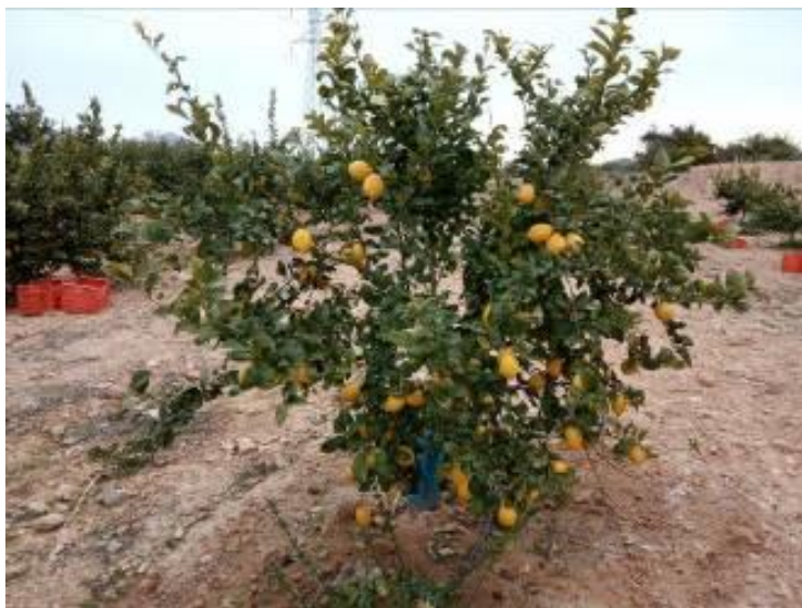
Forner alcaide 517