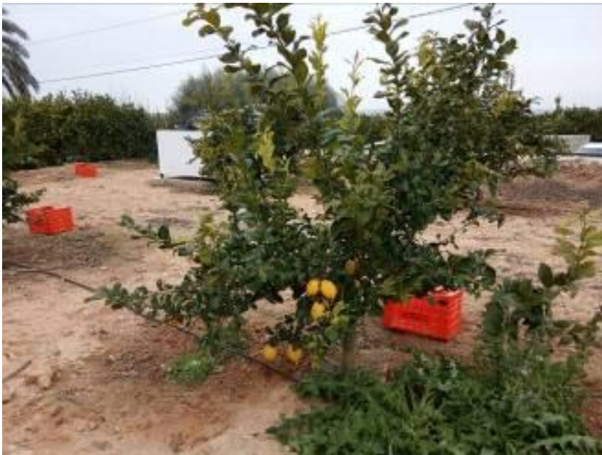
Forner Alcaide 5