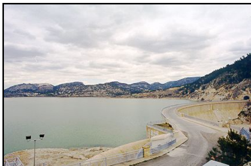
Pantano de Valdeinfiernos

Estas grandes rutas se encuentran señalizadas en todo su trayecto mediante señales de color rojo para orientarse en el camino.