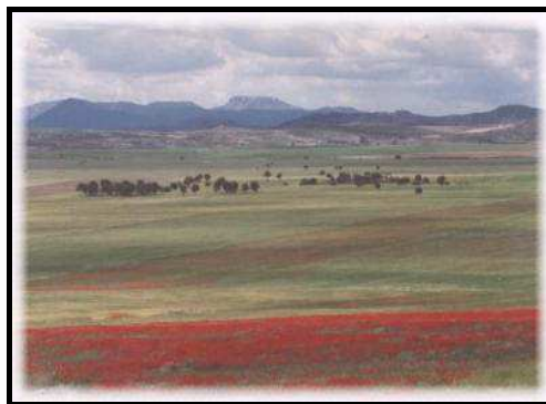
Campo de San Juan

El tramo de sendero en la comunidad murciana tiene cerca de 300 Km. de largo y es la columna vertebral del senderismo murciano. Inicia su recorrido por tierras de Murcia en Torre del Rico (Jumilla) y pasa por los parajes del altiplano, la vega del Segura y el Nordeste murciano. Atraviesa las tierras del vino y de los frutales y entra en la huerta de Cieza; cruza el río Segura y los arrozales de Calasparra hasta llegar a la Cañada de la Cruz después de cruzar la sierra de los Álamos y la Muela, cerca de los ríos Alharete y Benamor. Su recorrido es: Torre del Rico (Jumilla), rambla de la Raja, Puerta de Jaime, Venta Román, Azujarejo, Cieza, presa de Cárcavo, pantano, Calasparra, Moratalla (La Puerta), Cortijos de la Risca, ermita de San Juan, Campo de San Juan, Salinas de Zacatín, Calar de la Santa, El Sabinar, rambla de la Rogativa, ermita de la Rogativa, Puerto Alto y Cañada de la Cruz (Moratalla). Una variante de éste es el GR-7.1 con el itinerario: Moratalla, Caravaca de la Cruz y Cañada de la Cruz. Otra variante la constituye el GR-7.2 denominado Camino de la Cruz del Campo de San Juan de casi 30 Km.