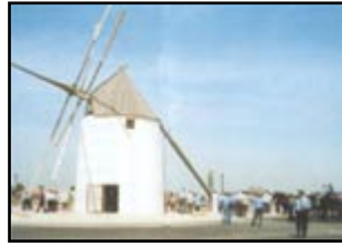
Molinos de viento en el Campo de Cartagena