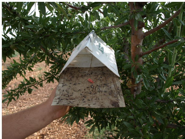
Trampa para el monitoreo de Anarsia lineatella (2018).

La actuación sobre plagas y enfermedades estará basada en criterios de intervención y materias activas recogidas en las normas de producción integrada. Llevamos el monitoreo del vuelo de Anarsia por si es preciso intervenir, sobre todo en las brotaciones jóvenes de las reinjertas. Se realiza normalmente un tratamiento de invierno con aceite de parafina y cobre porque se suelen encontrar elevadas las formas invernantes de varias plagas y enfermedades.