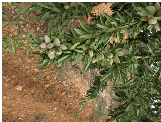
Rama de almendro de la variedad Lauranne.

Tratamos de mostrar el comportamiento de las variedades más interesantes de almendro de floración tardía y extra-tardía que, a su vez, se encuentran injertadas sobre diferentes patrones y, todas ellas, ubicadas tanto en secano como en riego localizado en el Centro de Demostración Agraria (CDA) Las Nogueras de Arriba en Caravaca de la Cruz.