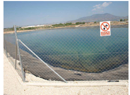
Embalse de riego Las Nogueras.