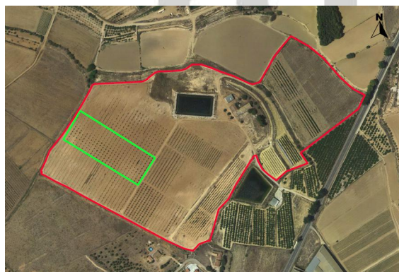
Croquis de ubicación de almendros CDA Las Nogueras.

El proyecto se desarrolla en la Finca Experimental de “las Nogueras”, en el término municipal de Caravaca de la Cruz, catastralmente en parte de la parcela 385 del polígono 129, ubicado entre las parcelas de demostración de nogal, al noreste y las de pistacho y trufa negra al suroeste, según el croquis de ortofoto: