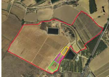
Ubicación de los cerezos.