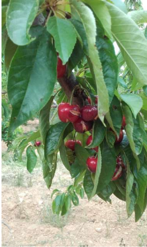
Rajado de frutos de cerezo (25/05/2020).