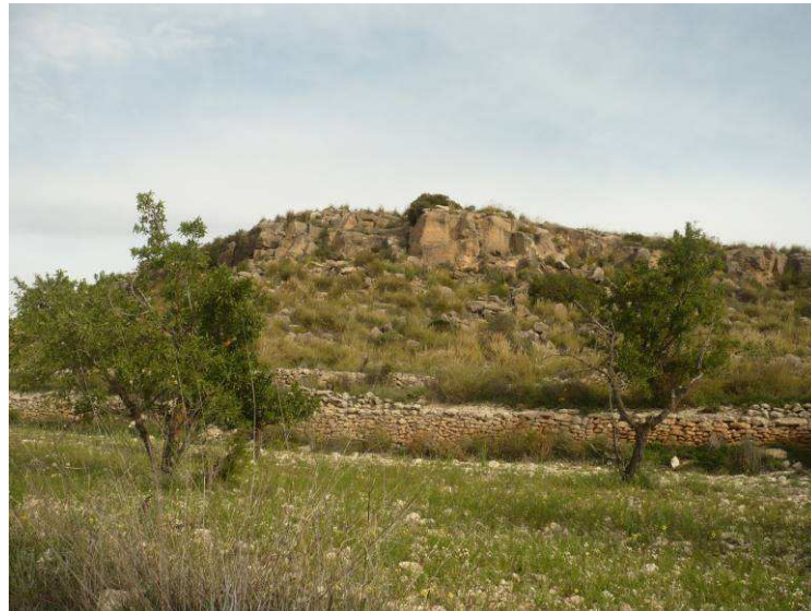
Figura 2. Panorámica de la parcela de ubicación de la explotación.

La parcela concreta en la que se pretende realizar la actuación se ubica sobre una pequeña elevación de carácter forestal, rodeada principalmente por terrenos agrícolas de secano tradicional. Al este de la parcela transcurre el límite del monte público y límite provincial de Alicante, y al sur con el camino de la Barquilla.