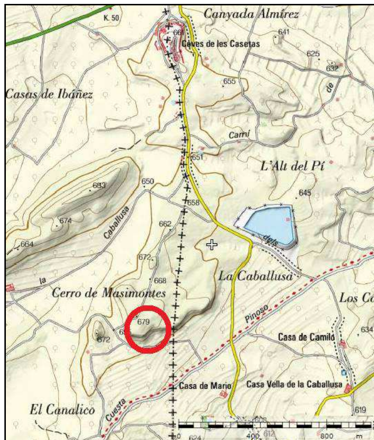
Figura 1. Localización del proyecto.

El enclave seleccionado para la explotación no se emplaza en el ámbito de espacios naturales protegidos, Red Natura 2000, u otras áreas especialmente protegidas.