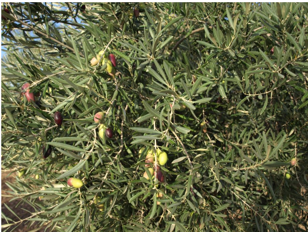
Cornicabra de Toledo