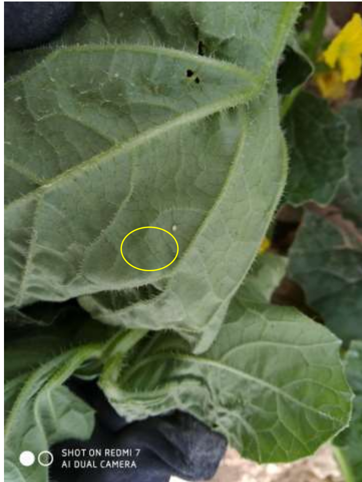
Indicios de pulgón en la zona con Primal