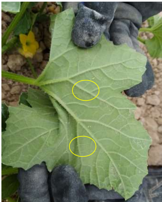
Indicios de pulgón en zona con Acetamiprid 20%