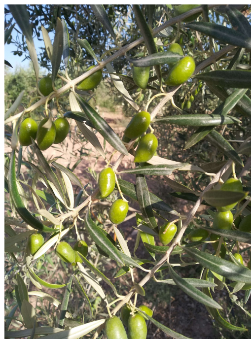
CORNICABRA DE TOLEDO