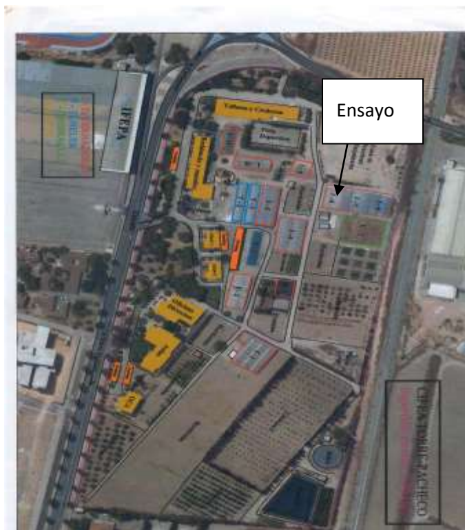
Figura 2: Plano del CIFEA de Torre Pacheco

La referencia del SIGPAC del CIFEA, es Polígono 19 parcela 9000, en la que engloba una gran cantidad de terreno, en la que está el CIFEA.