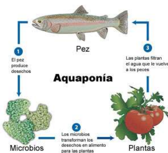
Figura 1: Fundamentos de la Acuaponía

Con este proyecto se pretende dar a conocer este sistema, de nueva implantación en la Región para su futura implantación en explotaciones agrícolas de la zona, ya que se puede conseguir un mejor aprovechamiento del agua y fertilizantes, reduciendo el consumo de nitratos y conseguir obtener dos productos disponibles para su comercialización con alto nivel frescura y calidad sanitaria.