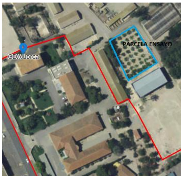
Fig.1. Situación de la parcela

La parcela de demostración se encuentra en el CDA LORCA, situado en la Carretera de Águilas, Km.2 del Término Municipal de Lorca en la Diputación de Tiata. La referencia SigPac de la parcela es Polígono 169, parcela 53 en el recinto 2. Las coordenadas UTM30: X: 615.776,33 ; Y: 4.168.326,08.