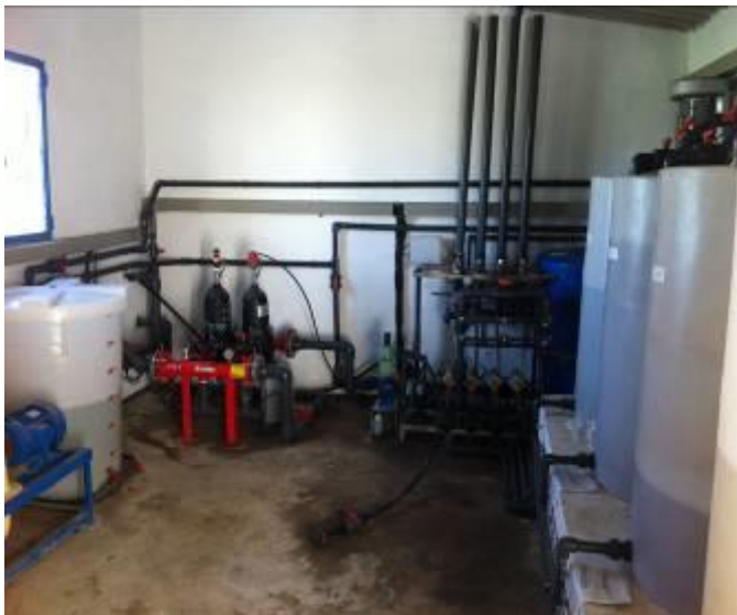
Fig. 2. Detalle del cabezal de riego

El agua de riego es suministrada por la Comunidad de Regantes de Lorca mediante una tubería de presión que surte a la finca de agua del trasvase Tajo-Segura.