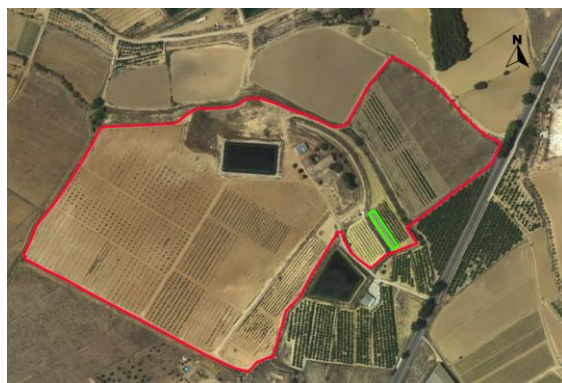
Croquis ubicación del cultivo del kiwi CDA Las Nogueras.

El proyecto se desarrolla en la Finca Experimental de “las Nogueras”, en el término municipal de Caravaca de la Cruz, catastralmente en parte de la parcela 385 del polígono 129, ubicado entre las parcelas de demostración de nogal, al noreste y las de demostración de pistacho y trufa negra al suroeste, según el croquis de ortofoto: