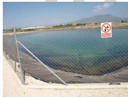
Embalse de riego Las Nogueras.