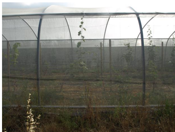
Plantación de Kiwis CDA Las Nogueras (2018).

Este proyecto tiene como fin determinar la viabilidad agronómica y económica de este cultivo