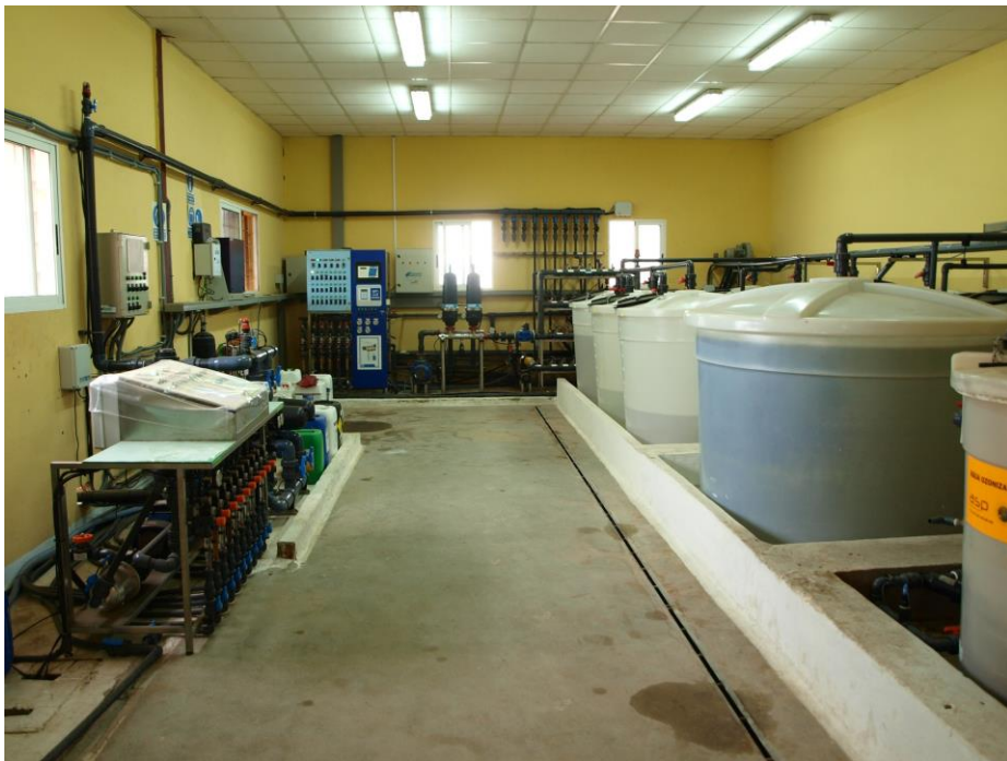
Cabezal de riego

Uso de programas de riego para evitar un consumo innecesario del agua. Este programa de riego tiene en cuenta parámetros como el clima y los datos del cultivo.