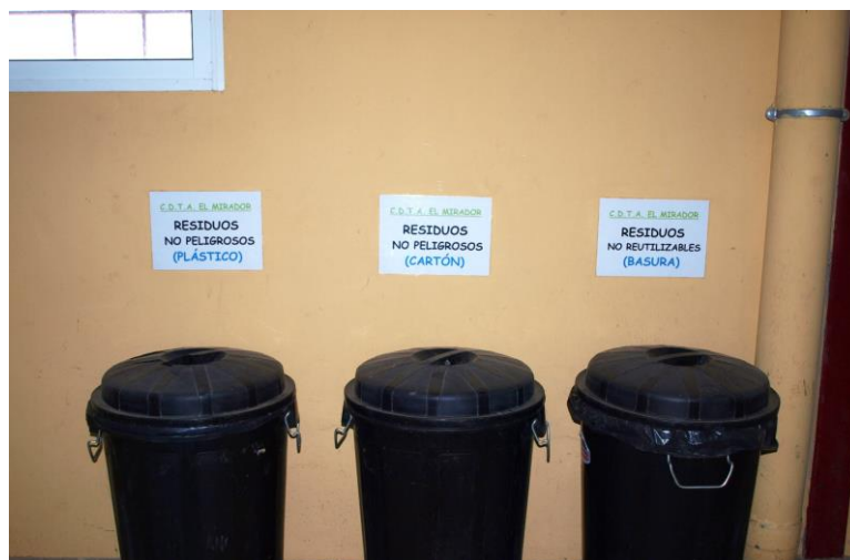
Contenedores para los distintos tipos de residuos

Se dispone en la finca de contenedores para los diversos tipos de residuos (papel, vidrio y envases) que periódicamente serán llevados a contenedores municipales.