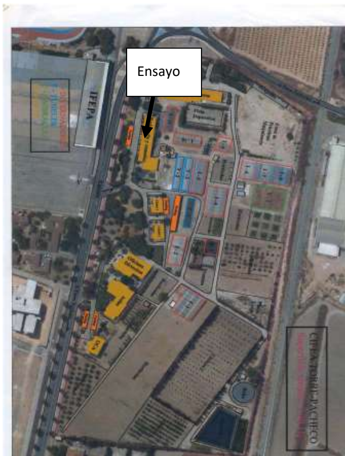
Figura 2: Plano del CIFEA de Torre Pacheco

La superficie del ensayo será de 240 m 2 .