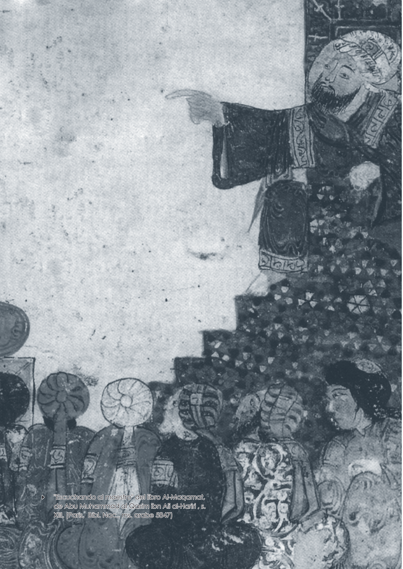
▷ "Escuchando al maestro" del libro Al-Maqamat , de Abu Muhammad al Qasim ibn Ali al-Hariri, s. XIII. (París, Bibl. Nac., ms. arabe 5847)