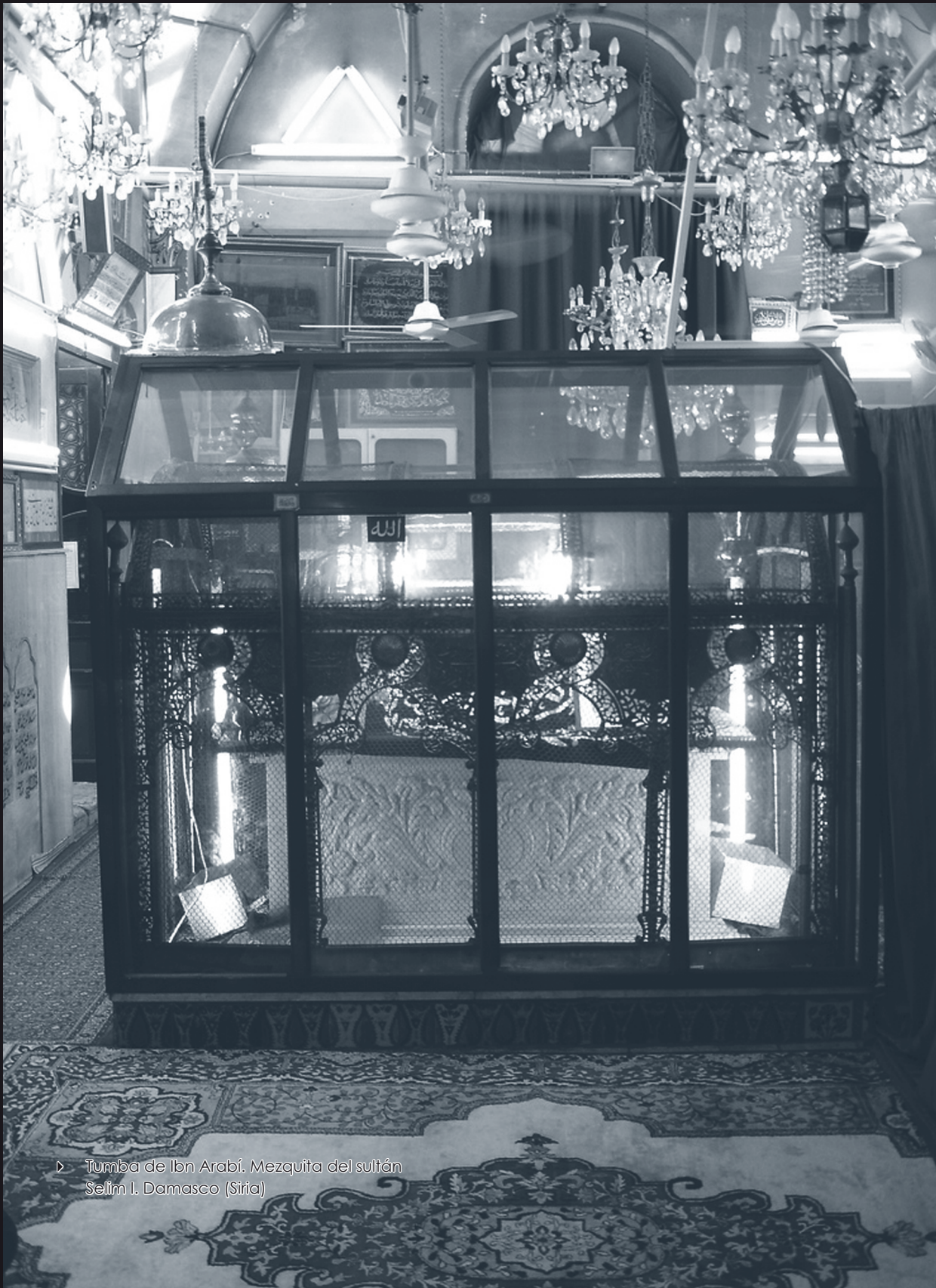
▷ Tumba de Ibn Arabí. Mezquita del sultán Selim I. Damasco (Siria)