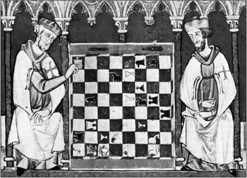
Miniatura del folio 25r del códice del Escorial (T.I.6)

En la inmensa obra de traducción y compilación que se desarrolla en tiempos del Rey Sabio encontramos el Libro de los juegos: Juegos diversos de axedrez, dados, y tablas con sus explicaciones, ordenados por mandado del rey don Alonso el Sabio , compuesto en 1283: