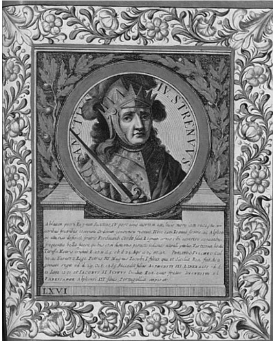
Sancho IV en el Cartulario de la Catedral de Toledo.

Tras la muerte de Fernando de la Cerda en 1275, en plena decadencia del Rey Sabio, se desarrollan los acontecimientos más amargos de la vida de Don Alfonso.