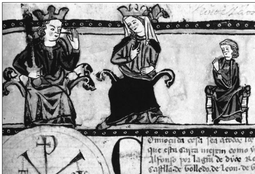
Miniatura del Tumbo de Tojos Outos. Archivo Histórico Nacional. Madrid. Supuestas imágenes de Alfonso X, D a Violante y Don Fernando de la Cerda.

El infante Fernando, hijo primogénito de Don Alfonso, nació con un gran lunar en la espalda del que surgía un recio pelo. De ahí el sobrenombre “de la Cerda”. Era el heredero de la corona de Castilla y León.