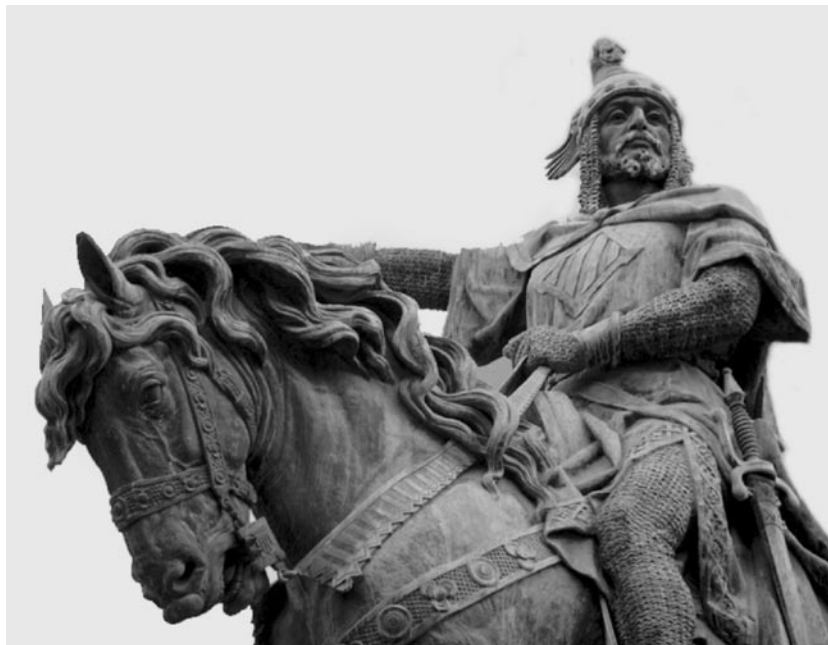
Escultura ecuestre de Jaime I. 1890. Valencia.

Entre el 19 de mayo y el 5 de junio de 1264 una sublevación general de los musulmanes murcianos puso en peligro el dominio castellano en la zona. Alfonso X pidió entonces ayuda a Jaime I, su suegro, quien en una rápida campaña entre los años 1265 y 1266 reconquistó y obtuvo sumisión de Alicante, Elche, Orihuela y Murcia, principales núcleos rebeldes.