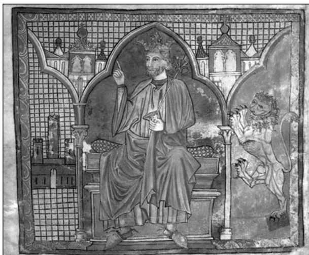
Fernando III “El Santo” en una miniatura de la Biblioteca de Santiago de Compostela. (Tumbo A, ACS CF 34, fol. 66 vº).

Fernando III conquistó en treinta años más que los reyes cristianos en los tres siglos precedentes. Con él, Castilla se asoma al Atlántico y al Mediterráneo y deja el último reducto musulmán de la Península cercado por tierras castellanas.