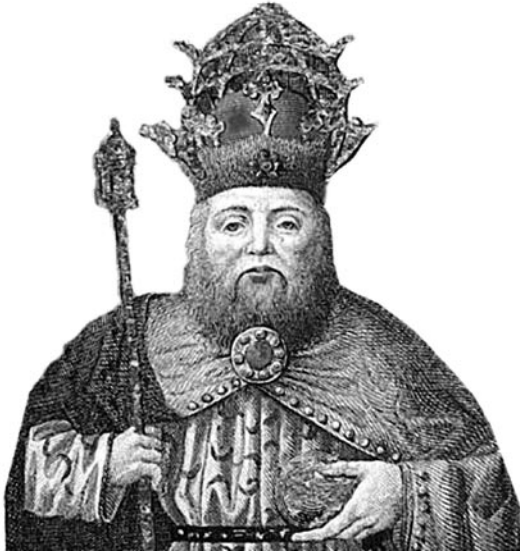
Grabado del siglo XIX con la imagen de Alfonso X como Emperador.

Alfonso X recibió en 1256 el apoyo de Pisa para su candidatura a “Emperador” y “Rey de Romanos”, que estaba vacante. Empleó grandes cantidades de dinero, incluso envió tropas para conseguir los apoyos necesarios, pero al año siguiente fue coronado el otro candidato, Ricardo de Cornualles, que tenía el apoyo del Papa.