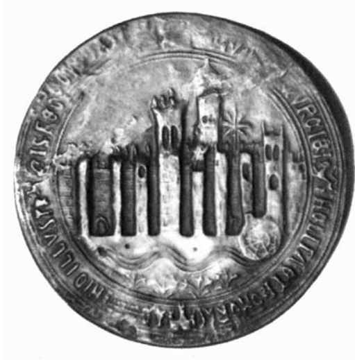
Sello concejil de Murcia. Siglo XIV. Anverso

En 1243 Don Alfonso se encontraba en Toledo, al frente de los ejércitos de su padre, enfermo. Allí acudieron los mensajeros del rey de Murcia, y le ofrecieron la capitulación del reino: