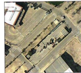
Fig. 1. Planta del ecoparque de San Pedro del Pinatar