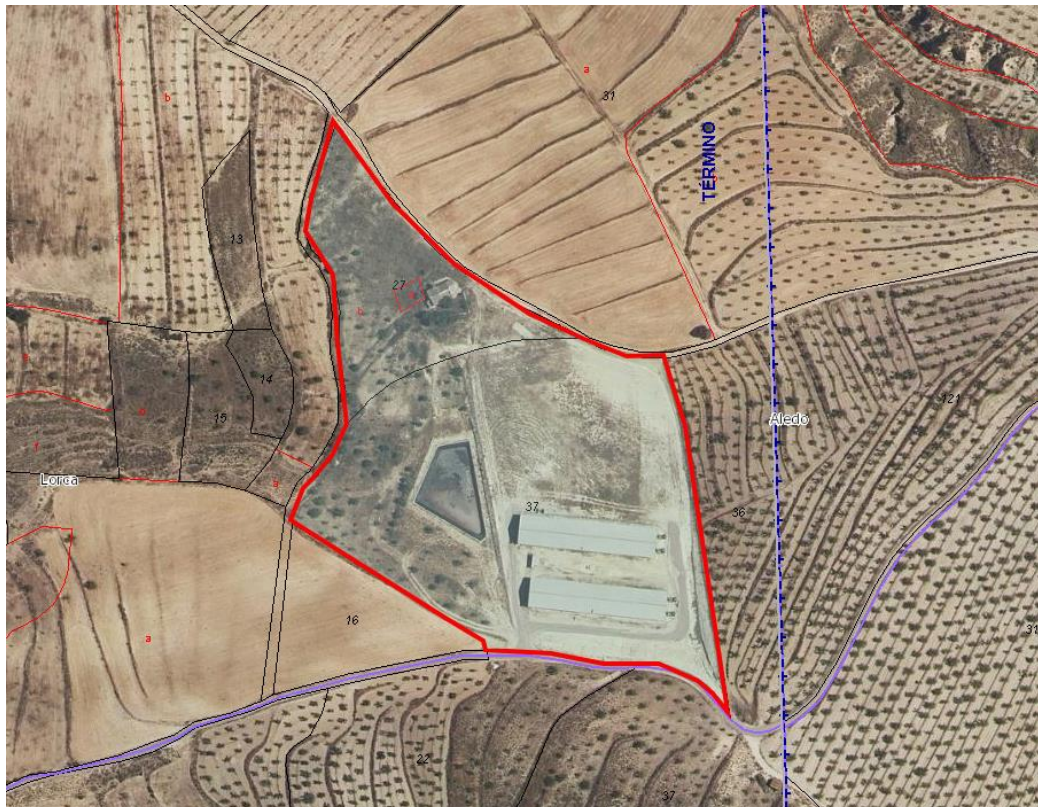
PARCELAS CATASTRALES DE LA EXPLANTACIÓN SOBRE ORTOFOTO