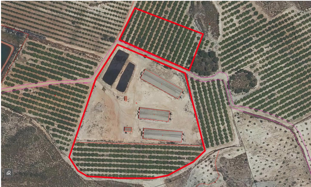
AMPLIACIÓN DE LA EXPLOTACIÓN EN POLÍGONO 27, PARCELAS 172 Y 177 DE FUENTE ALAMO

MARIN ARNALDOS, FRANCISCO 27/10/2022 13:06:48 Esta es una copia auténtica imprimible de un documento electrónico administrativo archivado por la Comunidad Autónoma de Murcia, según artículo 27.3.c) de la Ley 39/2015. Los firmantes y los fechas de firma se muestran en los recuadros. Su autenticidad puede ser contrastada accediendo a la siguiente dirección: https://sede.carm.es/verificardocumentos e introduciendo el código seguro de verificación (CSV) CARM-c84bc271-5130-dee4-0bbe-005059b6280