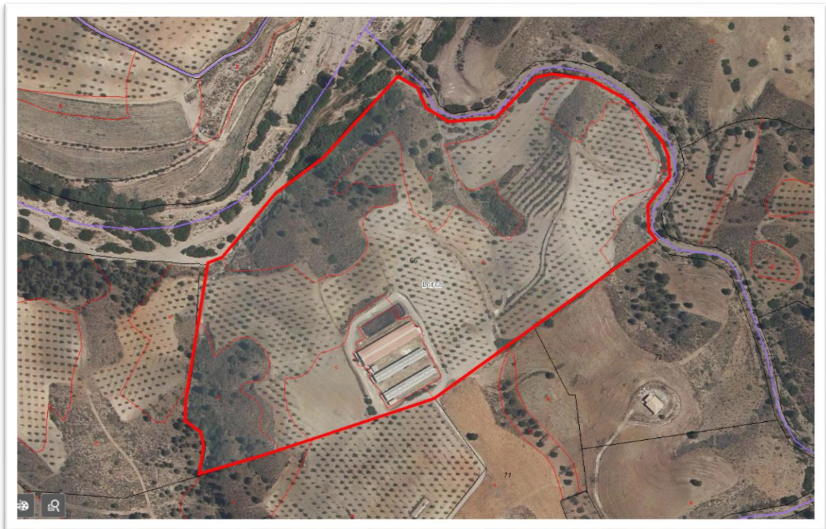
Parcela catastral 66 del polígono 225 de Lorca.